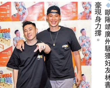
◆歐陽靖廣州騷獲好友林書豪現身力撐。