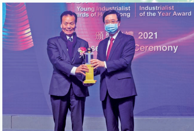
▲2021年，建滔集團主席張國榮（左）獲香港工業總會頒發「傑出工業家獎」，由時任香港政務司司長李家超（右）頒發獎座。