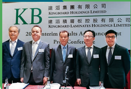
建滔集團多年獲福布斯評選為全球企業2000強，去年排名躍升300名至第1663名。