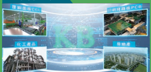
建滔集團旗下的業務已遍布全國多個省區，並已走出國門在泰國設廠，業務不斷多元發展。