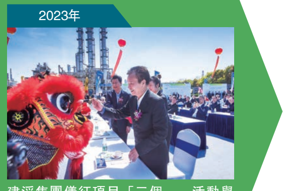
建滔集團儀仗項目「三個一」活動舉辦，推動經濟運行率先整體好轉示範。