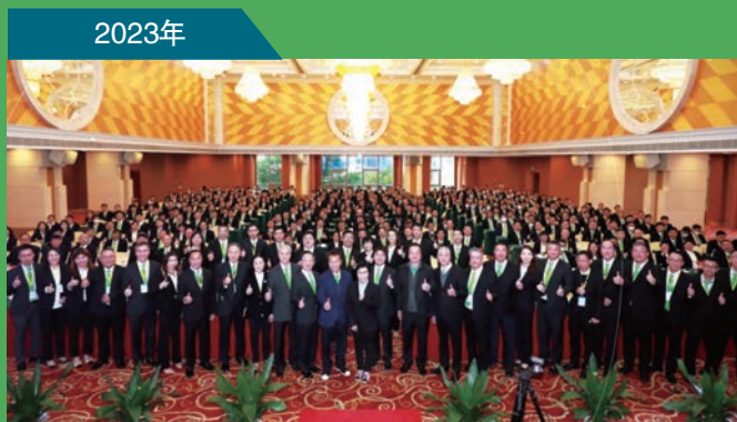
建滔集團骨幹成員大合照。