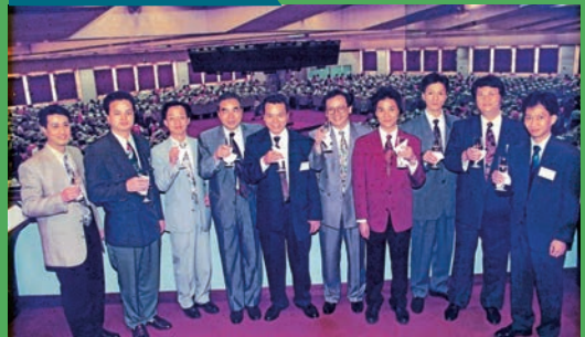
建滔集團有限公司於香港聯交所隆重上市。