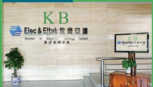
建滔集團成功收購依利安達集團。