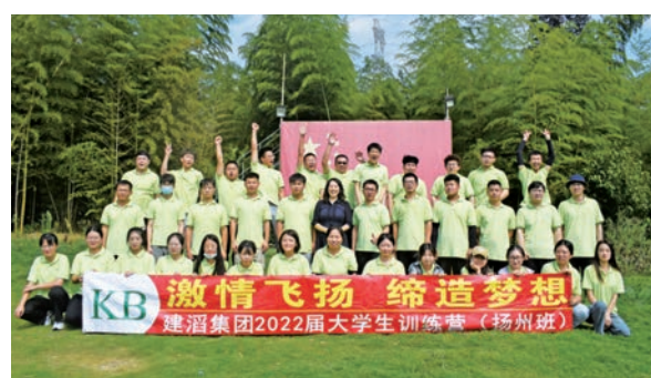
▲「激情飛揚 締造夢想」，建滔集團2022屆大學生訓練營。

「授人以魚不如授人以漁」，張國榮認為開展社會公益事業，除了贈魚，還要教人學捕魚。因此，在扶貧助困方面，建滔集團除了提供資金支持外，還為各工廠所在社區創造了大量的就業機會，例如僅在昆山市張