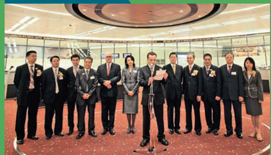
建滔集團子公司建滔積層板控股有限公司於香港聯交所隆重上市。