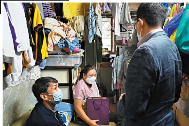
▲梁女士去年租住的劃房，環境惡劣。 資料圖片

也發現，不少街坊都認同政府編配過渡屋和公屋的速度有所加快，「希望政府能夠繼續保持現行的施政方向，幫更多基層市民早日上樓。」