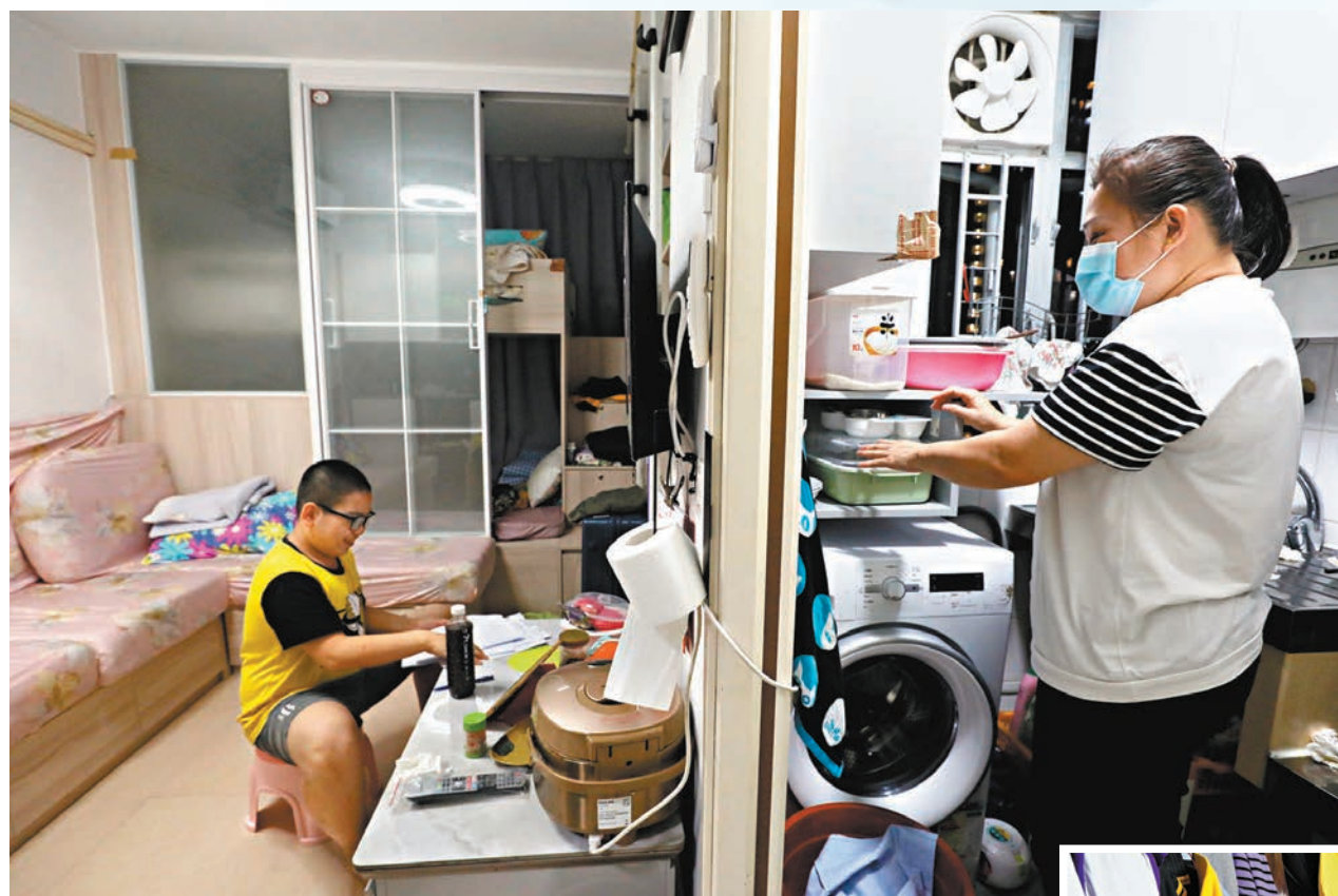
▲梁女士與兒子喜獲分配公屋，她說「終於有家的感覺」。

46歲的梁女士與香港文匯報記者相識於一年多前一次劃房戶探訪活動中。當時，她和鄭姓兒子居於土瓜灣一處百多平方呎的劃房單位，房間內堆滿衣服雜物，訪客也無從落腳，臉上滿露愁容。記者近日再次造訪，母子倆已遷入啟德朗邨逾兩個月，小小一間公屋單位經過簡單裝修後，顯得舒適而溫馨，他們的精神狀態也明顯振奮許多。