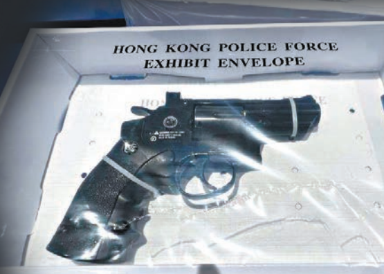
▲▼警方在將軍澳搗破一個住宅武器庫，並檢獲大批仿製槍、長短刀和利斧。

根據《火器及彈藥條例》，任何人管有仿製槍械，一經定罪最高可判監7年。同時，根據香港法例第217章，任何人管有違禁武器，一經定罪，最高可判監3年及罰款一萬元。根據《簡易程序治罪條例》，任何人管有攻擊性武器並意圖將其作非法用途使用，一經定罪，最高可判監兩年及罰款5,000元。