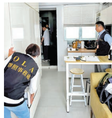
◆牌照事務處執法人員「放蛇」掃蕩無牌酒店。

發言人強調：「無牌經營酒店或賓館屬刑事罪行，一經定罪可被判監禁並留有案底，最高罰款500,000元及監禁三年，並可就罪行持續期間的每一日另處罰款20,000元；亦可針對涉及重犯罪行的處所發出為期六個月的封閉令。」旅客或市民如發現懷疑無牌酒店/賓館，請即致電牌照處舉報熱線（電話：2881 7498）、電郵至had-lacnq@had.gov.hk、傳真至2504 5805，或透過「香港持牌旅館」流動手機應用程式，向牌照處舉報。