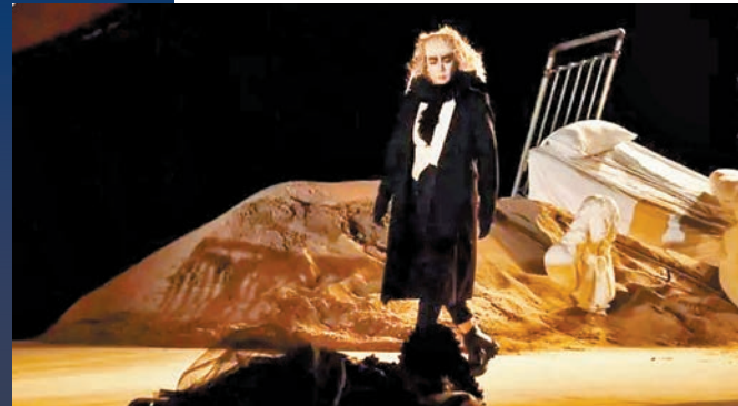
◆《十二首情詩》演出照。