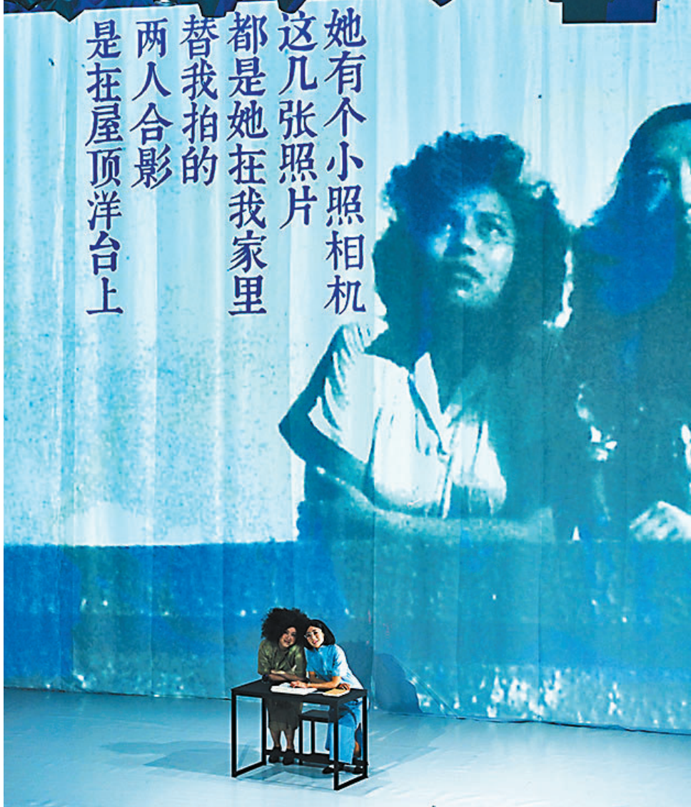
◆《說唱張愛玲》於阿那亞藝術節演出。