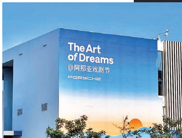
◆阿那亞戲劇節在秦皇島舉行。

戲劇貴在真實，藝術需要毛邊。由於與秦皇島外的汪洋大海無縫銜接，自然少不了天風海雨的親密光顧。由邵思凡導演的《伊娥》頂着暴雨，把觀眾帶入到了希臘神話的世界中，從神到人，從人到牛，劇情跌宕起伏，現實也一波三折。在演出過程中，因為雨勢過大，《伊娥》只能暫停。不過，觀眾們都非常理解，這樣的插曲和變數，或許也正是阿那亞戲劇節最獨特