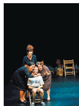
◆《悲慘親吻靈魂》演出照。主辦方供圖

偶劇在本屆戲劇節上也大放異彩。法國的《蟲子》和比利時的《仲夏夜之夢》都是用這種獨特的形式詮釋世界經典，但這兩部作品又有明顯不同。前者用人偶結合的方式詮釋卡夫卡名著《變形記》，又暗黑又幽默，發人深省；後者則通過半人半偶的嫻熟技術演繹莎士比亞劇，在歌舞雜耍中打破生命界限和性別定義，別具新意。