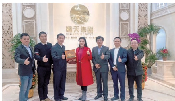
中華人民共和國外交部指導成立、中國亞洲經濟發展協會，大灣區發展總部坐落晴天集團。