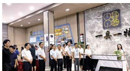
湖北省有關領導視察一縣一特(荊州)交易管理中心。