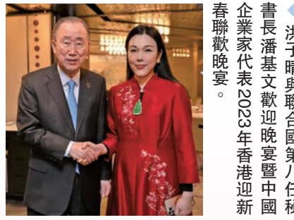
洪子晴與聯合國第八任秘書長潘基文歡迎晚宴暨中國企業家代表2023年香港迎新春聯歡晚宴。