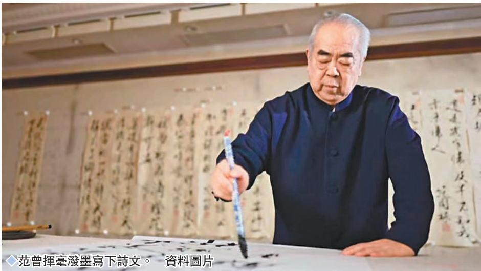
◆范曾揮毫潑墨寫下詩文。 資料圖片

師承者，指授受有源而學有所出也，在學術上與前輩一脈相承。事實上，任何一個卓有成就的大家，無不是在其師承的基礎上，在師門業已建構的學術基石上，進一步探賾闡微，求真創新，而臻於大成。深入研究范曾先生之所以成為一代大師的內在理路和箇中奧秘，我們便會發現，那種被媒體稱為「廣陵散從此絕矣」的世家文化傳承中的「家學」模式並未終結，仍舊以一種發幽薈萃的形式，延展着昔日的輝煌。這種不惟在我國、即使在世界上也屬僅見的「唯一性」，自有着無可限量的內在生命力。隨着《國脈家珍》的播放，我們深信這種「內在生命力」必將在新的歷史條件下重新煥發生機。