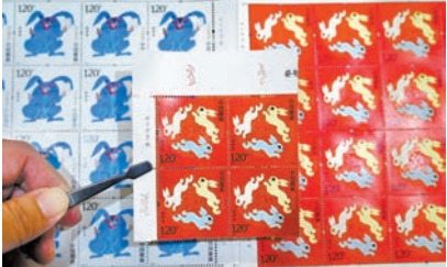
◆中國郵政每年都發行多款新郵票，圖為《癸卯年》特種郵票。

人生經歷過很多事，「八千里路雲和月」。但即使在特殊環境下，我依然保留着多本集郵本，而且數量還越來越多，也始終沒有放棄業餘集郵的愛好。回想起來我也感到吃驚，為什麼自己能在幾十年間，一如既往地集郵？或許因為那是我的「愛好」，是一種動力，它發揮了我的主觀能動性。