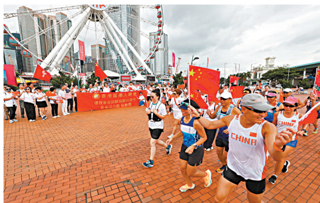
◆香港區潮人聯會昨日舉辦「慶祝香港回歸祖國26周年—青春活力跑」，逾百青年參加。

在高唱《歌唱祖國》後，眾青年跑手開始了奔跑之旅。大家全程揮舞國旗和區旗，向市民和遊客展示香港的多元文化