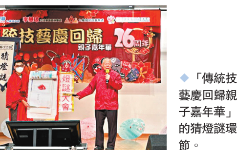
◆「傳統技藝慶回歸親子嘉年華」的猜燈謎環節。

香港文匯報訊 民建聯九龍城支部聯同九龍城民政事務處、李慧琼立法會議員辦事處、樂童創藝義務工作者聯會昨日合辦「傳統技藝慶回歸親子嘉年華」，藉一系列傳統技藝表演如變臉、古彩戲法、兒童粵劇折子戲、猜燈謎，以及各民間特色攤位，如傳統弓箭體驗、麵粉公仔工作坊、投壺遊戲等，讓市民及新一代認識了解中華文化。