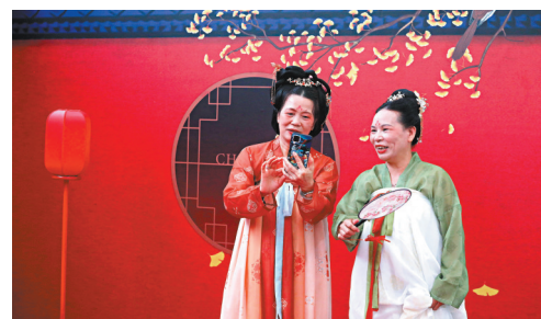
◆左起：吳小姐和梁小姐穿上唐服到場。