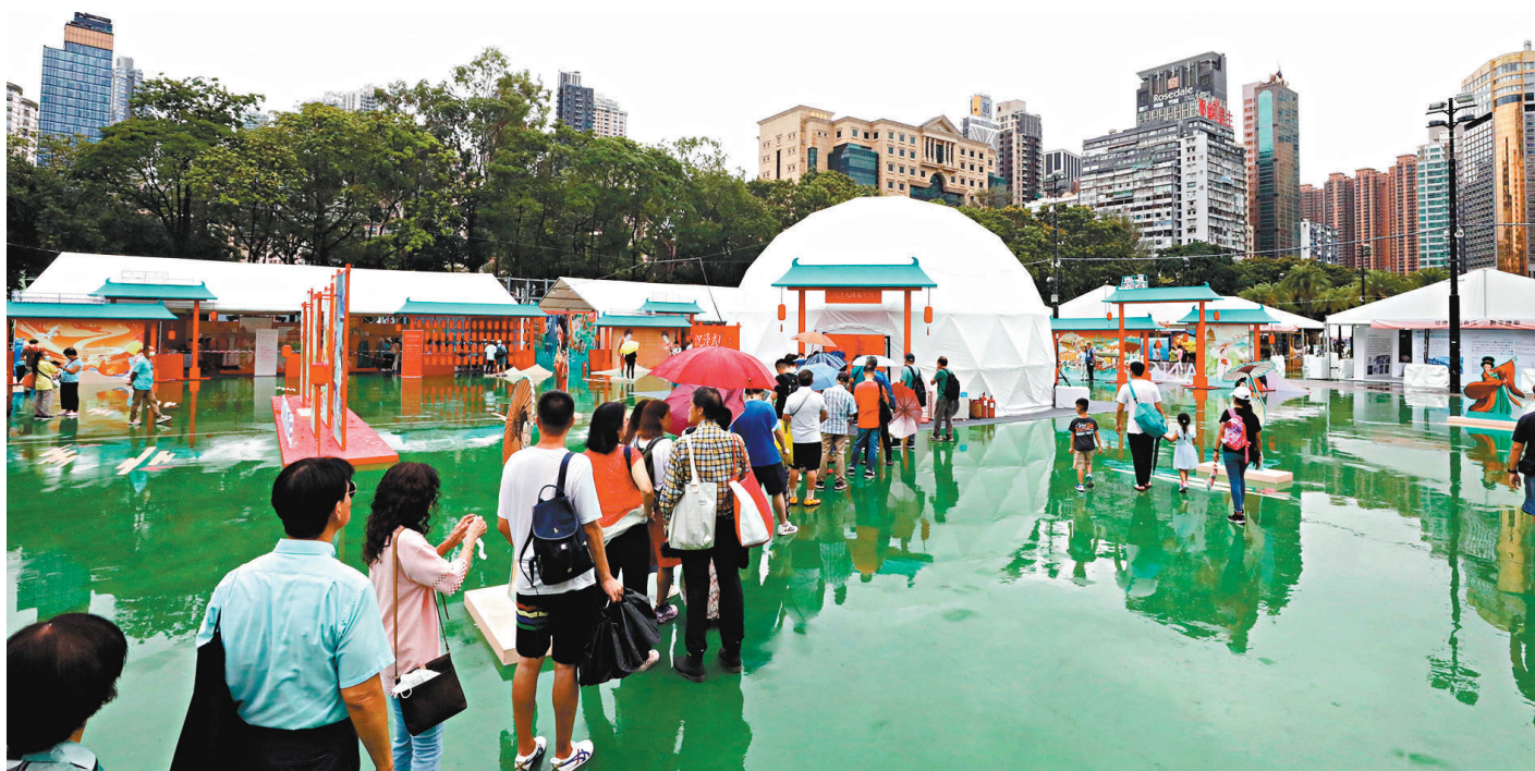
◆雖然昨日天公不作美，不時下雨，但仍有市民冒着大雨把握機會到場「打卡」，感受古今文化交融。

對於現場所有展區產品不設售賣，曹小姐指，賣東西並非展覽初衷，而是希望更多人知道認識其產品，讓產品「走出遼寧」。