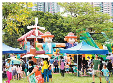
◆在「萬人慶回歸同樂日」活動內，設置多個充氣城堡、手搖船、夾公仔機等讓市民免費享用。

香港文匯報訊 香港政青青年聯會及青年議會於7月1日至2日在深水埗南昌公園舉辦「萬人慶回歸同樂日」活動。公園內設置了多個充氣城堡、手搖船、夾公仔機等不同娛樂項目，讓市民免費享用。大會預計兩日共吸引約1萬多人參與，其中大部分兒童來自基層。政青希望透過同樂日為社區注入活力，與市民共享回歸的喜悅。