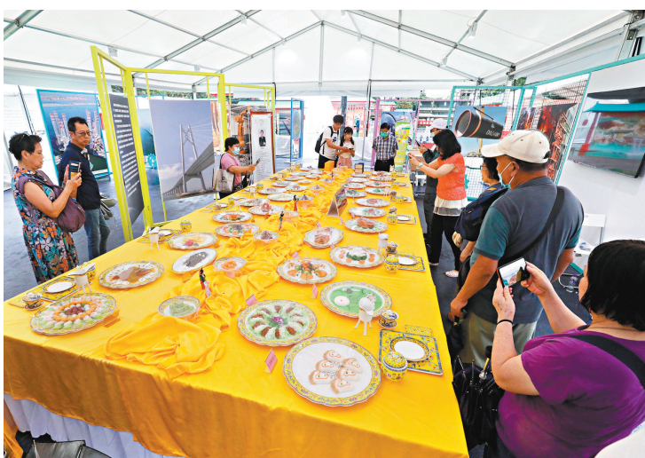
◆在非遺食品展區中，擺滿滿漢全席的複製菜式，一眾市民看見甚為雀躍，彷彿親歷其境。