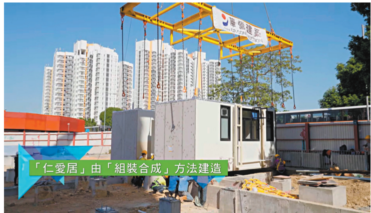
◆「仁愛居」項目採用「組裝合成」建築技術，以「先裝後嵌」方法，讓承辦商在地盤組裝單位組件。視頻截圖