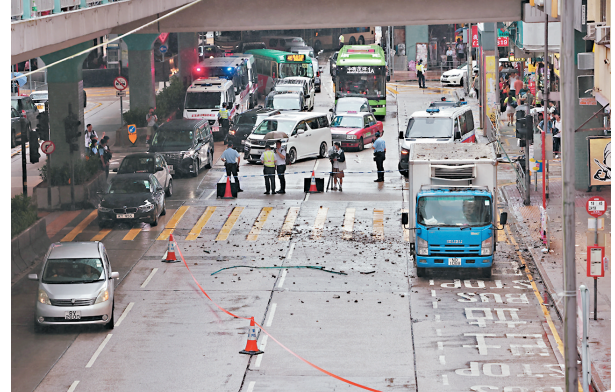
◆警方將現場大廈對開4條行車線封閉，路邊是被墜下石屎擊中的貨車。

香港文匯報訊（記者 蕭景源）旺角一大廈昨日發生外牆石屎簷篷塌下意外，一幅位於頂層位置約4.5米乘0.5米的石屎簷篷，疑因日久失修突告崩塌，連同部分