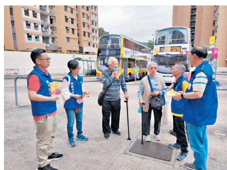
◆置富關愛隊透過街站接觸居民，了解他們的需要。

煙活動，例如戒煙挑戰和支持小組。通過這些努力，我們希望幫助居民擺脫煙草的依賴，擁有更健康的生活方式。此外，我們將推出「身心鬆一zoom」計劃，透過線上瑜伽課程，培養居民在家運動的習慣，讓他們可以不受天氣影響，隨時隨地在家活動筋骨。這個計劃將為居民提供方便的運動選擇，同時，瑜伽可以幫助居民放鬆心情，在練習的過程中可以把煩惱暫時拋諸腦後，有助促進身心健康。我們還會展開認識認知障礙症推廣計劃，希望可以提高人們對認知障礙症的認識和關注，並提供相應的訓練，以幫助居民早期識別認知障礙症，及早治療。我們的工作不只是提供健康相關的服務，更是社區的橋樑，凝聚社區。通過促進健康生活，我們將幫助居民建立更緊密的社區聯繫，增強居民的歸屬感。我們也