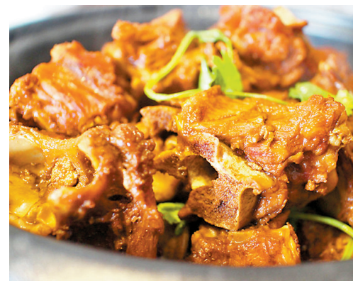
◆羊蠟子是指羊的脊椎骨。橫切面看上去呈「Y」字狀，像張牙舞爪的蠟子，故被老饕們戲稱「羊蠟子」。圖為羊蠟子火鍋。

可是，他在信末還要補加一句：「如果這吃法行之於天下，相信一眾狗兒都不會高興。」——極盡戲謔帶來極致的幽默，這絕對是達觀的蘇軾會做的事情。