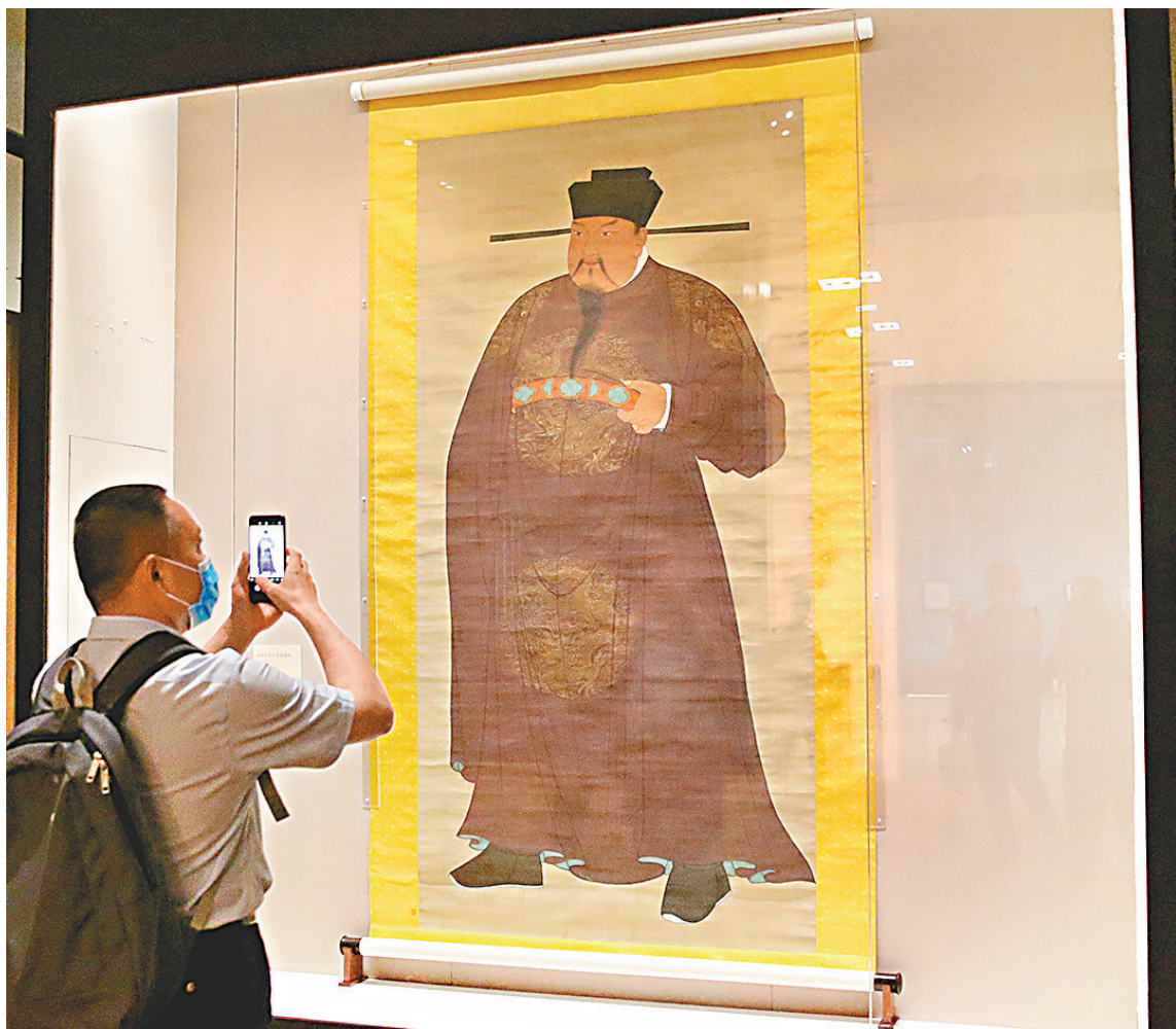
◆北宋開國皇帝宋太祖趙匡胤自己掌握禁軍，由部下「皇袍加身」擁立為帝。圖為博物館展出的趙匡胤肖像畫。

不過，這衍生的問題也不少，如王明孫《宋遼金元史》提到：「全國實力集中於中央，能戰能禦的軍隊只在於禁軍，太宗兩度北伐征遼，全靠禁軍，戰敗之後，則全國無可用之兵，國勢就此衰弱不振。」宋室以缺乏軍事經驗的文人主持國防和領軍，成效欠佳，而更戍法令軍隊調遷頻繁，耗費龐大，也使兵將分離，作戰能力降低，對外戰爭勝少敗多。地方的精兵和剩餘的稅收全歸中央，地方無力建設，遇有邊族入侵，也無力抵禦。這使宋亡於外族之手，得不償失。