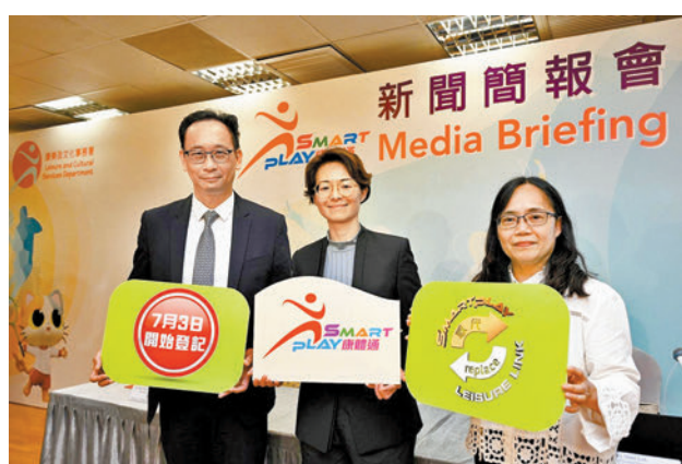
康文署介紹全新智能康體服務預訂資訊系統SmartPLAY,並示範操作智能自助服務站和流動應用程式。

未滿11歲而並未持有香港身份證的人士,遞交網上申請時則需要上載個人身份證明文件,例如持有香港出世紙的兒童可帶同其香港出世紙正本親身到各區設有訂場櫃檯的康樂場地辦理認證手續;如持有簽證身份書、回港證或前