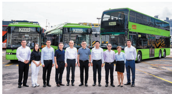
比亞迪訪問團與九巴代表在新款電動巴士前合照。

他表示,未來會與九巴緊密合作,憑比亞迪的先進電池技術及豐富的商用巴士應用經驗,進一步提高電巴營運效率,為國家以至香港實現碳中和出一分力。