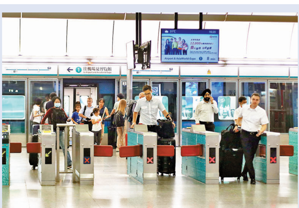
港鐵舉行「慶祝機場快線服務香港25周年活動」暨啟動儀式,介紹有關機鐵25周年慶祝活動及最新服務安排。

他表示,曾有一名旅客遺留載有巨款的公事包在車廂內,幾經轉折把公事包歸還該名旅客,對方感激萬分,想送錢打賞港鐵職員被拒,該名旅客道別後,職員再發現他遺失護照,馬上追上把護照歸還該名「烏龍」旅客。