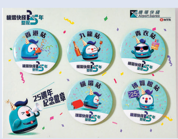
機場快線為慶祝25周年,推出紀念徽章。