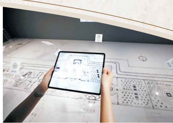
◆展覽亦透過擴增實境(AR)、混合實境(MR)及人工智能(AI)等技術，讓觀眾得以動態方式理解世界文化遺產。