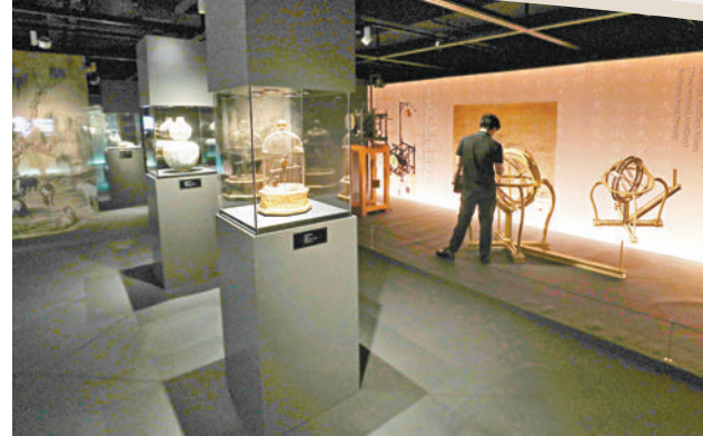
◆展覽展出「北宋水運儀」、「蘇頌渾儀」及「早期歐洲機械塔鐘」的復原模型。