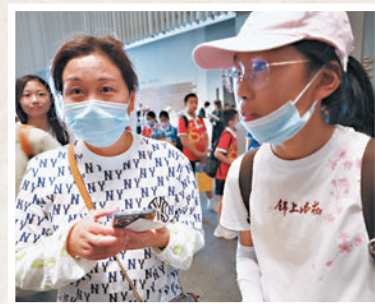
◆鄒女士(左)和女兒(右)很驚喜能夠趕上故宮館的周年慶。