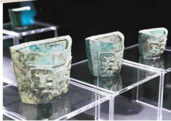
◆第一期展覽展出公元前九世紀的西周中期鑄造的青銅食具。