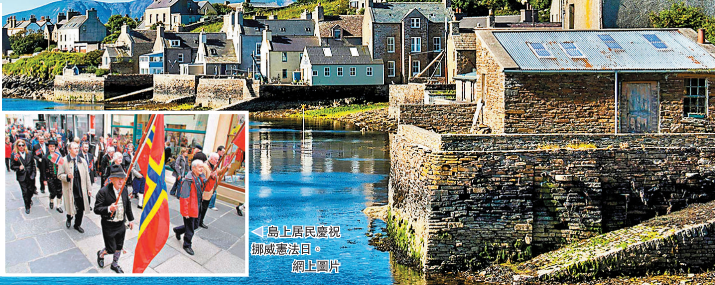
島上居民慶祝挪威憲法日。

香港文匯報訊 隸屬於英國蘇格蘭的奧克尼群島 (Orkney Islands) 行政首長近日提出一項脫離英國的提案，希望能成為挪威的自治領地。奧克尼政府下周將討論這項提案，研議「另一種治理形式」。