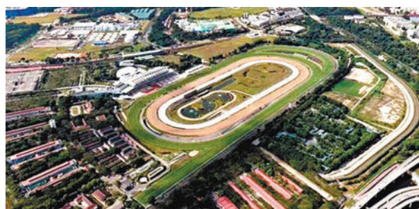
新加坡政府將於2027年收回馬場用地。

香港文匯報訊 新加坡政府將在接下來3至4年，研究克蘭芝馬場地段的土地用途、基礎設施設計和規劃，以在2027年收回土地後，展開土地準備工作和重新發展事項。分析師指出，該地段規模不足以發展為單獨市鎮，