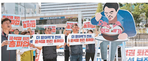
韓國工會宣布開始兩周大罷工。

香港文匯報訊 韓國最大工會組織周一發起為期兩周的大罷工，要求總統尹錫悅下台、上調最低工資，以及制止日本排放核污水，預計有40萬至50萬人參與。