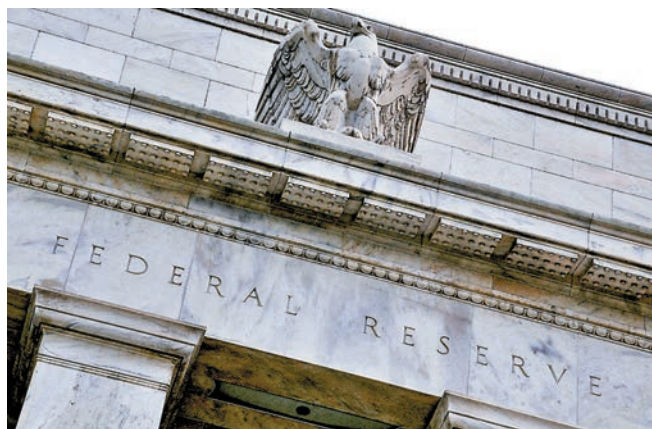
◆人們對美國聯邦儲備理事會(FED)對抗通脹的潛在激進程度產生一些懷疑。