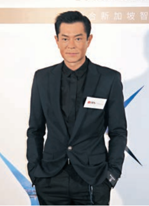
◆古天樂稱有超過20年沒吃過媽咪的拿手好菜炸乳鴿。

香港文匯報訊(記者阿祖)古天樂(古仔)日前與米芝蓮新加坡廚師合作拍攝廣告,古仔表示也愛吃喇沙、海南雞及碳燒魔鬼魚等新加坡菜。而今次廣告中,古仔未有機會一展廚藝,他亦笑指自己廚藝只屬一般,但基本的如蒸肉餅他都會煮,只是工作太忙也沒閒情入廚,對於有些人下廚來減壓,他則覺得入廚步驟繁複,對他而言煮一餐飯倒是很疲累。古仔指媽咪最初也不懂廚藝,他記得5歲前每天都會吃到煎牛排,因為做法沒有難度,之後媽咪才從電視上跟方太學煮家常菜式,炸乳鴿還成為媽咪的拿手好菜,不過他都有超過20年沒吃過媽咪的手藝,只怕要準備的功夫很多,他都不想讓媽咪辛苦。 古仔一直有投資食肆,疫情過後有否想過擴充其飲食生意?古仔說:「暫時沒有,不過經常有試菜,廚師見我點頭就會加入成為新菜式。」本身是個嘴刁的人?古仔笑說:「辛苦搵來在食,現在我每日吃一餐,只吃晚餐,但就不一定要吃佳餚,炸雞、pizza我都無所謂。」 古仔目前正為新戲趕拍中,卻因天氣問題令進度受阻:「外景不是熱到甩肺,就是落大雨,到轉拍廠景又來出太陽,其他工作未算有太大影響,但拍攝時間則要拖長了。」