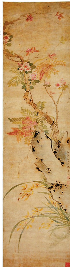
◆清方婉儀花卉圖軸