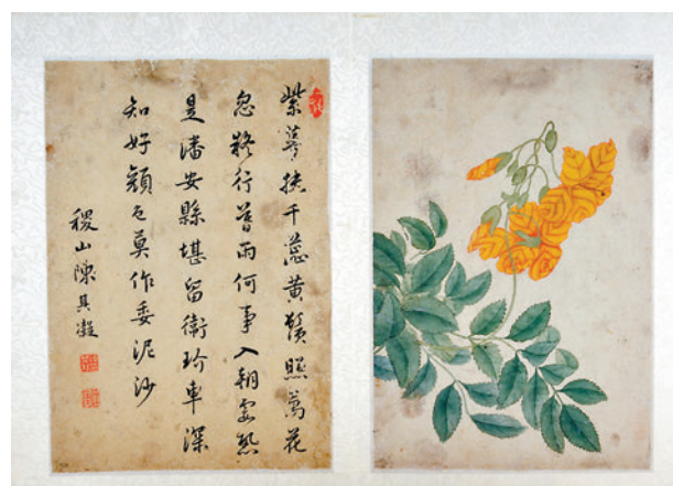
◆葉小鸞款花卉圖冊（其一）