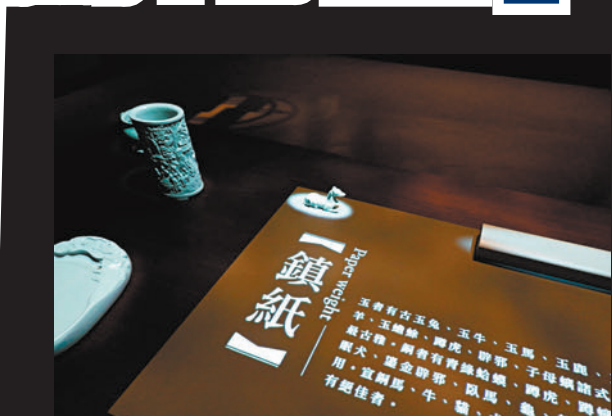
◆觀眾可以點擊了解文房內的物品。