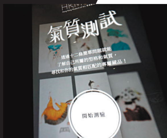
◆觀眾可先進行氣質測試找到自己的「專屬藏品」。