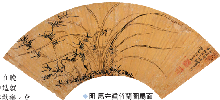
◆明馬守真竹蘭圖扇面