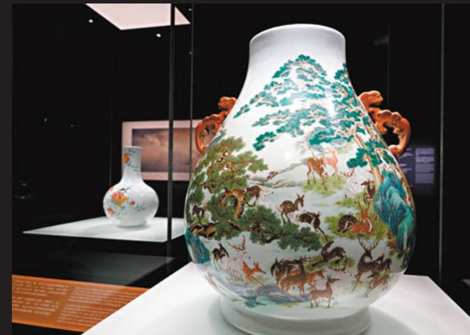
◆清乾隆粉彩百鹿圖大瓶