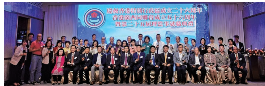
◆一眾主禮嘉賓於就職典禮上合照。

香港廣西同鄉會日前於尖沙咀The One潮韻薈舉行慶祝成立五十六周年暨第二十五屆理監事會換屆就職典禮，王榮森榮膺新一屆理事長。中聯辦港島工作部副部長王卉，港區全國人大代表、立法會議員吳秋北，立法會議員陳恒鑌、梁文廣、李梓敬，防城港市統戰部部長委春忠，欽州市外事辦副主任韋斯耀，防城港市僑聯主席宋寧，廣西商會會長饒永和香港廣西社團總會副會長李進等應邀主禮，逾六百出席嘉賓、鄉親及會員踴躍賀賀，場面熱鬧。