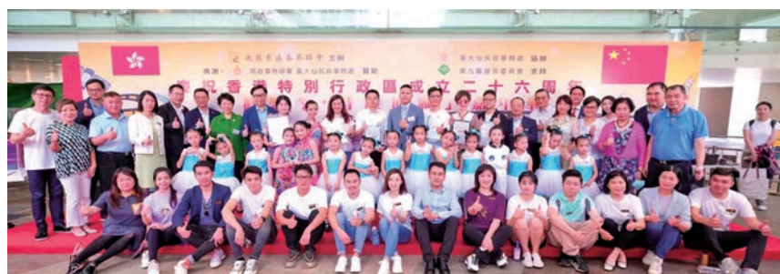
◆「歡樂今·昔慶回歸」嘉年華上賓主同歡合照。

昔為今用，今昔共融，活動旨藉「今」和「昔」的不同年代多角交替結合，塑造出充滿新舊文化並存的情景氣氛，貫穿幾代情懷無縫接軌，實現「同惜互享、同心共樂」的新時代慶回歸氛圍。場內特設懷舊小食攤檔及新潮航天士多，讓市民回味昔日懷舊小食所帶來的點滴記憶，並體驗航天高科技食品的实际效益。主辦單位更特意揀選了多項象徵元素極強的航天展品，如艙內航天服、長征火箭模型、離心機及空間站等模型展覽，並加上本土的驕傲，香港大學的HKU No.1衛