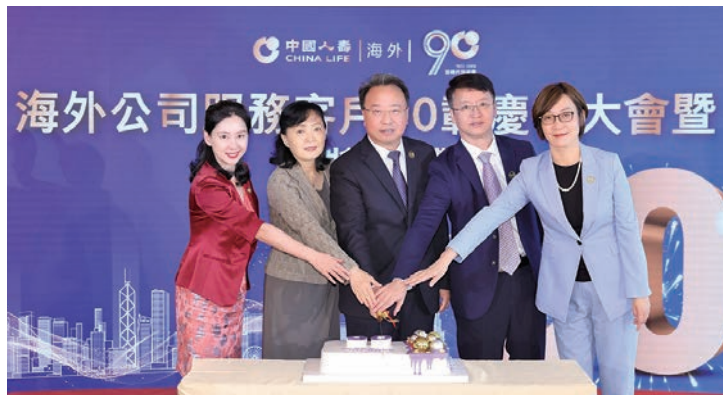
◆中國人壽(海外)服務客戶90載，祝願公司再創輝煌。

慶祝大會在別具一格的火炬傳遞儀式中啟動，代表着中國人壽(海外)歷史傳承和輝煌成就的火炬，在海內外各地傳遞，既展示了公司90年來的