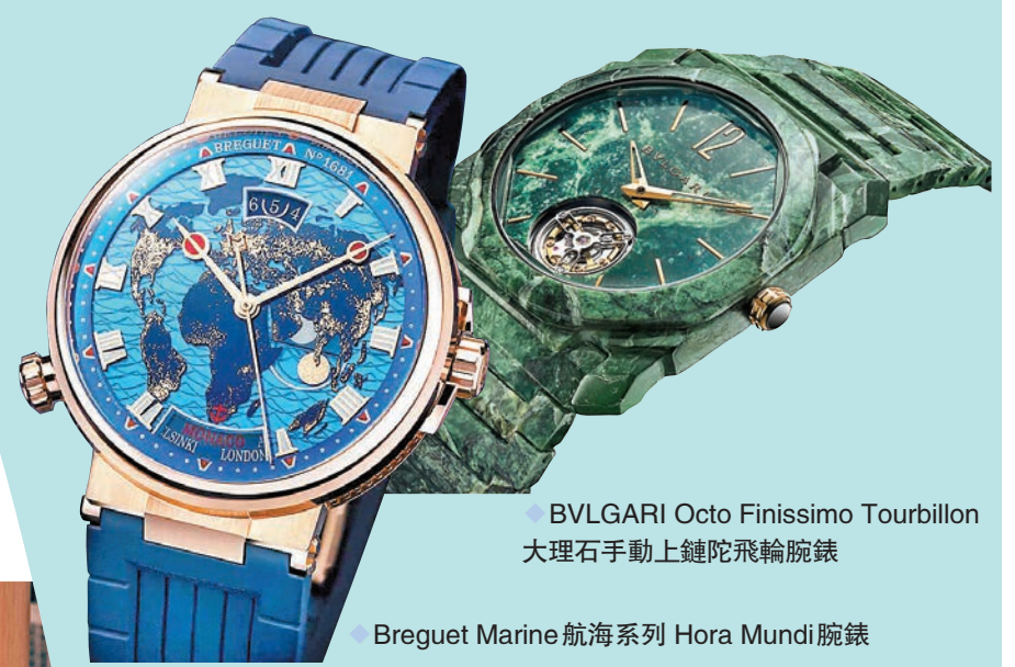
◆ BVLGARI Octo Finissimo Tourbillon 大理石手動上鏈陀飛輪腕錶