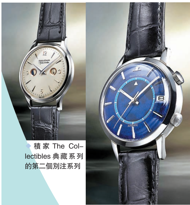
◆ 積家 The Collectibles 典藏系列的第二個別注系列