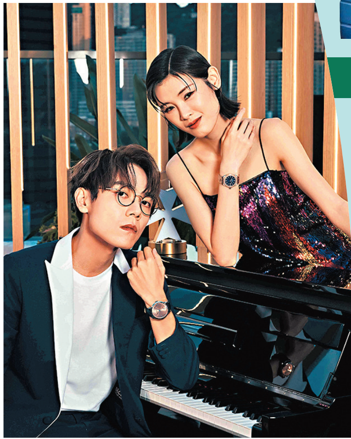
◆ 江詩丹頓全新腕錶：Patrimony 逆跳星期日期及 Overseas 自動上鏈腕錶。

稱設計的1978年贏得「Prestige de France」獎項的兩地時間腕錶，及於1985年製造的獨特黃金及白金雙色袖口錶等作品，均展現出精心設計的比例，純粹簡潔和清晰明快的線條恰如其分地呈現出充滿和諧的美感。