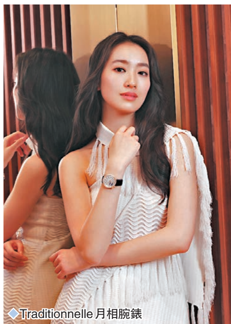
◆ Traditionnelle 月相腕錶

作為一個擁有近270年從不間斷製作腕錶的歷史和專業知識的高級製錶品牌，江詩丹頓置地太子專賣店重新開幕，專門店全新設計靈感源自品牌設計美學，店內的展櫃以富表現力的方式展示了品牌精湛的高級製錶技藝：一系列由設計簡約到配備複雜卓越功能的時計，包括多款在今年日內瓦Watches and Wonders高級鐘錶展上發布的全新腕錶，以至專賣店限定及限量款式，涵蓋品牌標誌性的時計系列——Patrimony、Traditionnelle、Overseas、Égérie、Fifty-six、Historiques和Métiers d'Art等。