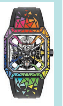
◆ BR 03 Cyber Rainbow

Bell & Ross全力支持今年Only Watch慈善拍賣會，捐贈一枚設計大膽、獨一無二、色彩繽紛及意念創新的BR 03 Cyber Rainbow共襄善舉。這七色彩虹慈善腕錶以品牌經典BR 03為藍本，注入嶄新創意並融合Cyber系列概念。腕錶製作從精巧的自製機芯及複雜的錶殼做工可見一斑：鏤空機芯及擺陀結構富有立體感，製作技術以噴砂打磨類鑽碳塗層，金屬夾板表面的不規則分格填上鮮艷彩漆，噴砂打磨金屬指針填上白色Super-LumiNova夜光物料，光暗環境顯示皆清晰易讀。而且，橡膠錶帶的彩漆裝飾色調柔和，造出搶眼的馬賽克圖案效果。自動上鏈機芯具有48小時穩定動力，其擺陀是特別為這枚腕錶研發，從錶面觀之，可見機芯及彩色夾板凸顯錶盤的前衛外觀、輕巧的結構及精密的手工。