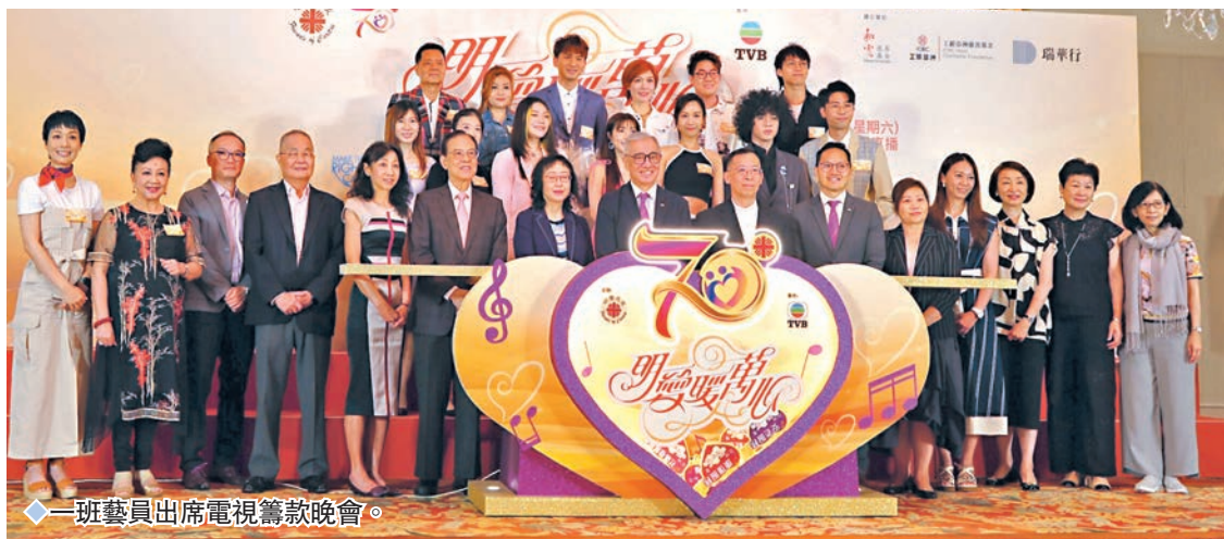
一班藝員出席電視籌款晚會。