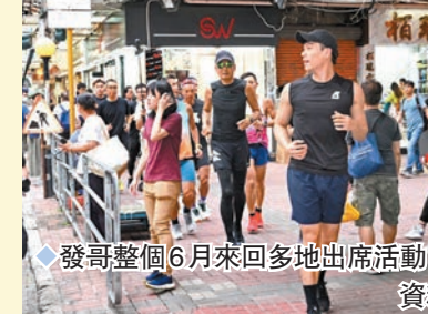
發哥整個6月來多地出席活動。

發哥表示：「原本應承今個星期繼續跑戲院同大家見面、分享、selfie。但呢兩日覺得唔舒服，並於昨日(7月4日)確診新冠，所以暫時未能同觀眾見面；等身體好返，我會重出戲院，同大家見面。祝各位身體健康，保重！」