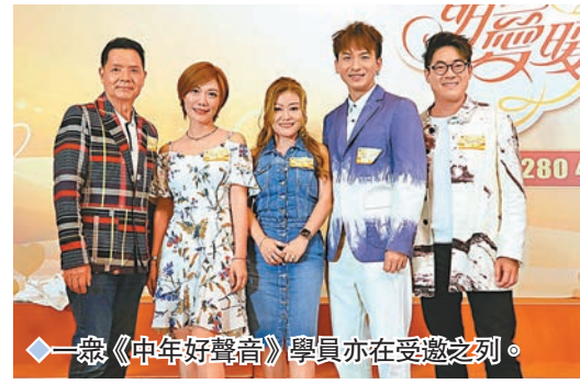
一眾《中年好聲音》學員亦在受邀之列。

呻悶，甚至地位都已被牠取代，以前太太會嗆寂寞，但現在就算無牠也不覺寂寞，並已適應香港的生活。說到她的太太經常入馬場，坤哥指太太在日本時從事賽馬主理，也想在港從事有關工作，他坦言：「可以減輕負擔，太太都想拍戲，之前佢幫我做MV女主角，全世界都讚佢演技好過我，(批准太太性感演出?)太太唔鍾意性感。(拍吻戲呢?)我都未同佢拍過吻戲，拍吻戲要加錢。」坤哥又預告將於年底開騷，地點暫時未定。