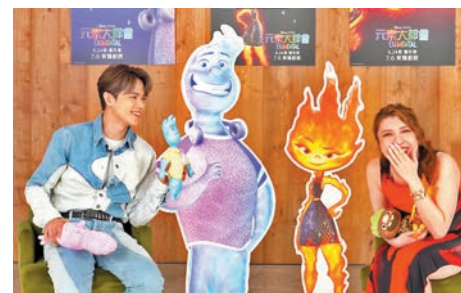
Serrini聽聞軒仔的浪漫表白後失笑又火爆。

而軒仔最難忘的情節，是火爆的「小焰」首次向「阿水」傾訴心事，軒仔相信這一段是很多人的人聲。對於Serrini，她最難忘的反而是常常在「小焰」身邊團團轉的「阿葛」這個角色。而且「阿葛」有一個很特別又搞笑的地方會開花，大家記得入場親自揭曉。