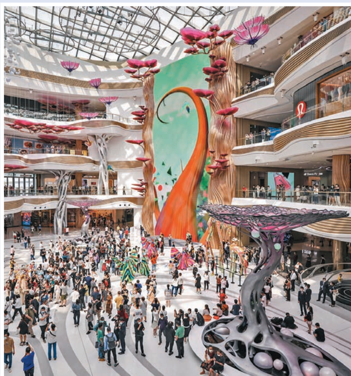
◆市場需求轉弱，令內地服務業增速有所放緩。