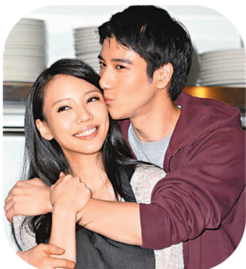
◆王力宏與李靚蕾的戰火持續延燒。 資料圖片