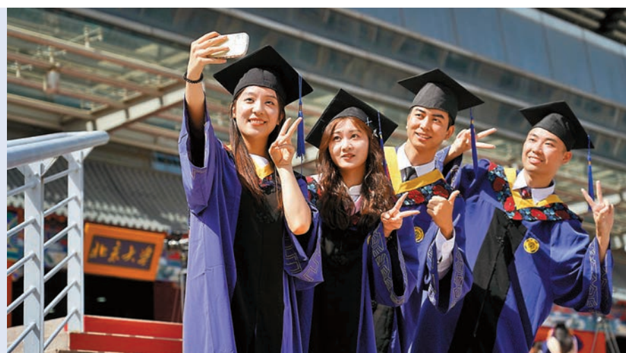
7月5日，畢業生在北京大學2023年研究生畢業典禮暨學位授予儀式結束後拍照留念。