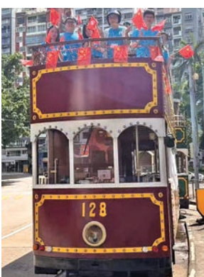
學員電車巡遊慶祝回歸。