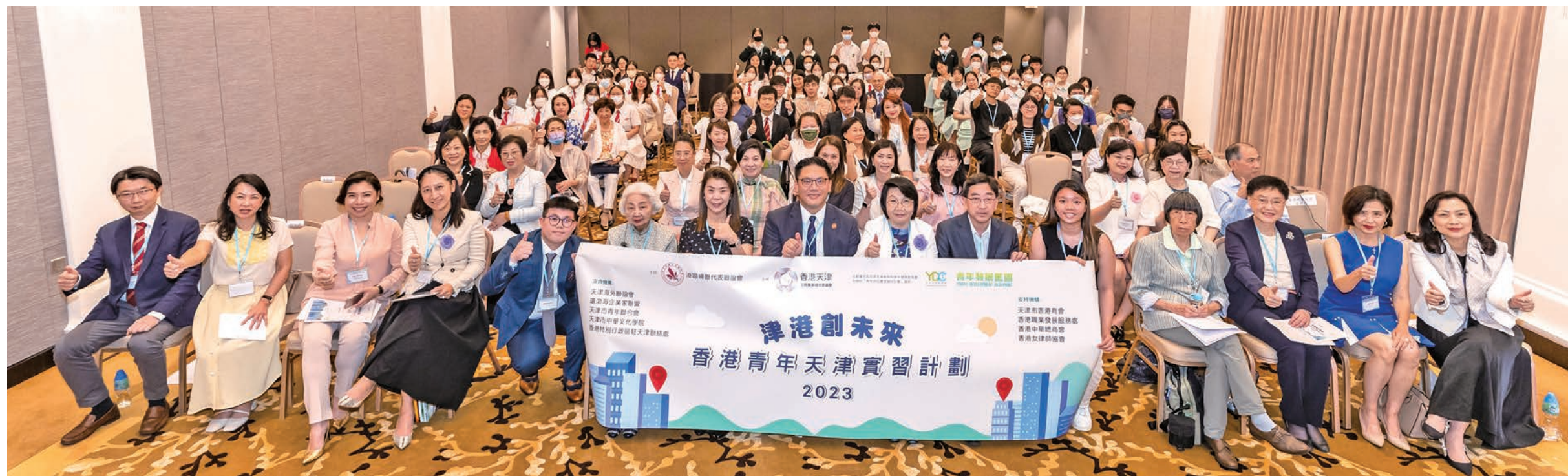
過百嘉賓及學員出席「津港創未來—香港青年天津實習計劃2023」在香港舉行的啓動禮。

港區婦聯代表聯誼會（簡稱「港區婦聯」）與香港天津工商專業婦女委員會（簡稱「港津婦委」）合辦「津港創未來—香港青年天津實習計劃2023」。計劃獲香港特區政府民政及青年事務局（簡稱「民青局」）撥款，資助30名大專院校學生赴天津參與最多43天的實習。