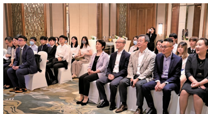
學員在天津與支持機構負責人一起參加啓動禮。