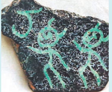
◆圖四：作者藏品，古美人在各自的始祖「紅山龍」、「紅山鴉（鳥）」的護佑下生存。

個指向「龍」的青銅大立人。第三，三星堆遺址已出土的青銅器可提供旁證。那個輪狀器，最先專家的解讀是車輪，又說是盾牌。後來又被指認為西方太陽器的「傳入」與「移植」。我的猜測是已修復的青銅大立人頭後的太陽飾物。炎帝族群的原始信仰是「薩滿」，太陽崇拜則是「薩滿」的第一崇拜。放置於頭後，筆者在提供兩件古玉（石）雕塑佐證。請看圖六（正背面兩幅）和圖七。