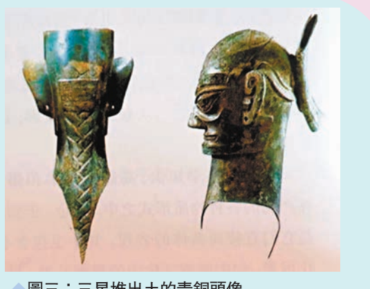
◆圖三：三星堆出土的青銅頭像

三星堆是什麼？三星堆就是一座祭祖的大課堂。出土的眾多青銅像，不是神，不是獸，更不是半人半獸。全是人，全是創建長江文明的先民。參與祭祀的人是三星堆已發掘出的古蜀「魚鳥」王朝的君王與臣民。指向「魚鳥」不僅有出土的金杖（皮）上的圖案和頭像所指，出土的青銅頭像也標示清楚。圖三的左圖是辮髮之人，古籍記載為「魚氏」。右圖之人腦後有插筒，那應是插鬼鳥的羽冠的！