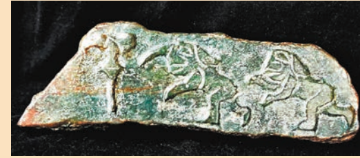
◆圖十三：文物記錄了古代中國人如何將「杖」由「工具」上升為「禮器」。

更有甚者，提倡「西來說」的當今中國著名學者，拉扯出中國近代考古學前輩李濟先生在幾十年前提出的「英雄擒獸」主張之說，李濟先生認為商代銅器上的這種母題源於近東文明。筆者仔細觀看了「英雄擒獸」母題的兩張圖，一丁點也看不出其中的「文化傳播抑或文化趨同」。筆者沒有學力去考證李濟先生說沒說？或者怎樣在說？筆者以為即便李濟先生幾十年前曾有過這樣的認為，也應辯證地去分析，去加以引用。在國勢積弱之時，把中國的事兒不分青紅皂白地一股腦兒往西方認知上去靠。不奇怪。自身虛弱，缺乏自信。前輩學人的局限可以理解。但在今天，在中國從站起來到富起來到強起來的新時代，還去「言必稱希臘」，還去津津樂道地嚼古今洋人嚼過的饅，能嚼出味來嗎？或者嚼出個什麼樣的味！