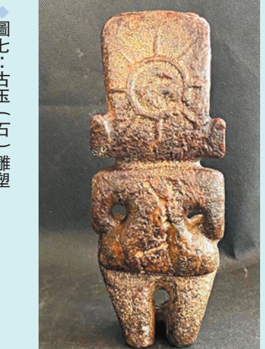
◆圖六：古玉（石）雕塑正背面