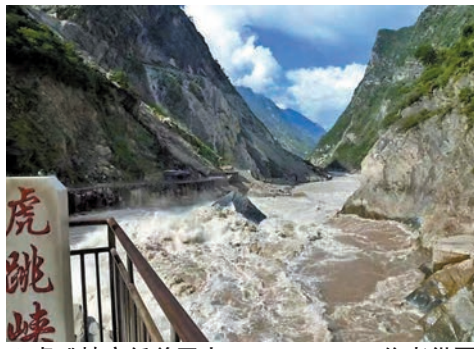
虎跳峽高低差巨大。

中虎跳離上虎跳5公里，從上虎跳一直北行就可到達中虎跳。在中虎跳，金沙江水流被兩岸絕壁擠迫收攏，變成了一條狂躁的猛龍，奔湧翻滾，濤聲震耳！這一段江面落差甚大，不到5公里的地段