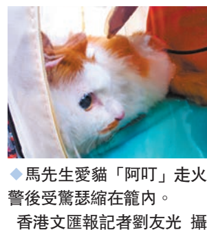
◆馬先生愛貓「阿叮」走火警後受驚瑟縮在籠內。