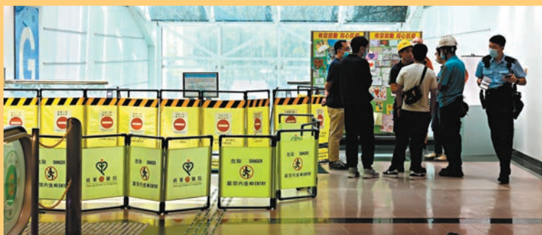
◆意外後，警方封鎖扶手電梯進行調查。