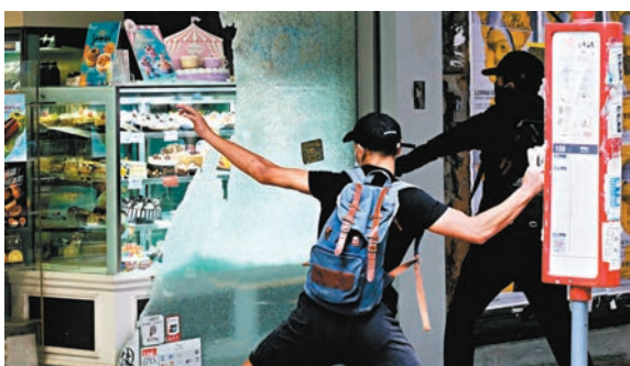
◆2020年7月1日，一批黑暴分子在灣仔及銅鑼灣一帶打砸燒破壞社區。

香港文匯報訊(記者 葛婷)2020年7月1日，一批黑暴分子上街搞破壞，其間有人在灣仔集成中心外將煙霧餅放入紙箱，發生爆炸，冒出白煙。警方事後拘捕兩名涉案男子，控以公眾妨擾罪。兩人分別在審前認罪和受審後被裁定罪成，昨日在區域法院被判囚19個月和26個月。暫委法官王興偉判刑時表示，被告精心策劃案件，擺放煙霧裝置會造成社會恐慌，猶如「白色恐怖」，沒有途人受傷是不幸中之大幸，無論被告意圖為何，社會絕不能姑息，須判起阻嚇性刑罰。