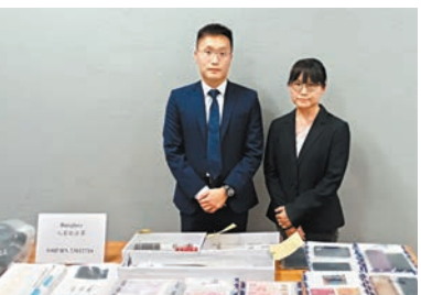
◆警方講述揭破爆竊集團案件詳情及展示檢獲證物。

該3人每次犯案手法類同，包括事前「踩線」，每次均為尾隨住客進入大廈避過保安員視線，在爆竊時會各自分工爆竊及「睇水」。