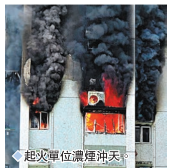
◆起火單位濃煙沖天。