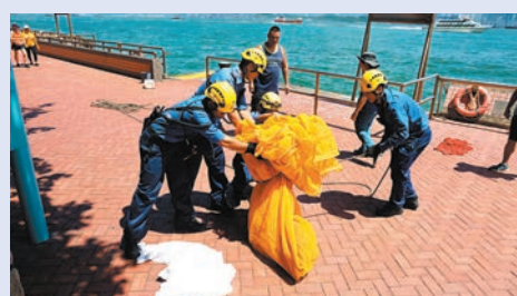
◆人員合力制服野豬。