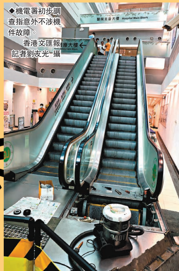
◆機電署初步調查指意外不涉機件故障。

男 傷者姓趙(50歲)，為扶手電梯承辦商職員。昨日上午9時半，他和3名同事到將軍澳醫院主座為扶手電梯例行檢查，預計在下午約1時結束工作，但在完工前發生意外。