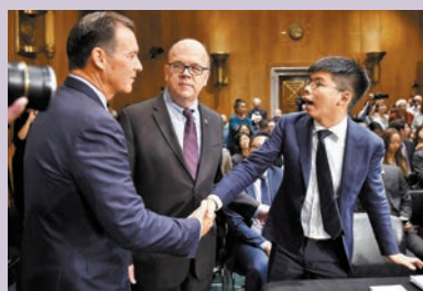
◆2019年9月，黃之鋒獲邀到美國國會出席聽證會。

創立「學民思潮」的黃之鋒組織2012年「反國教運動」，他率領一批學生強行霸佔政府總部廣場後，