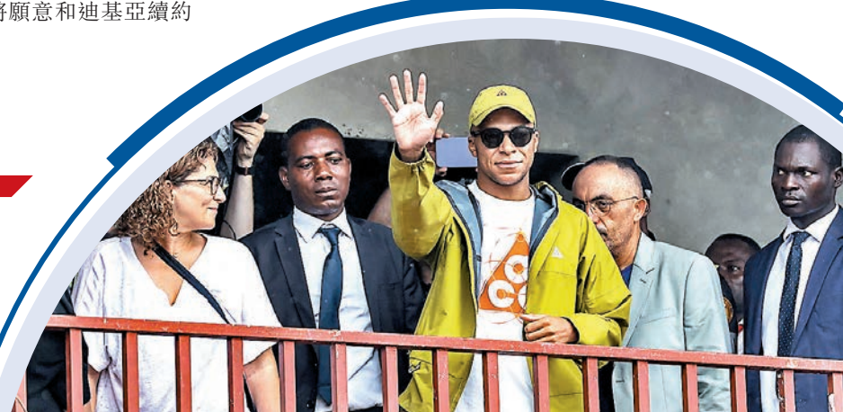
◆麥巴比日前出訪父親的出生地喀麥隆。