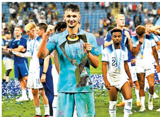
◆查科特表現備受讚賞。