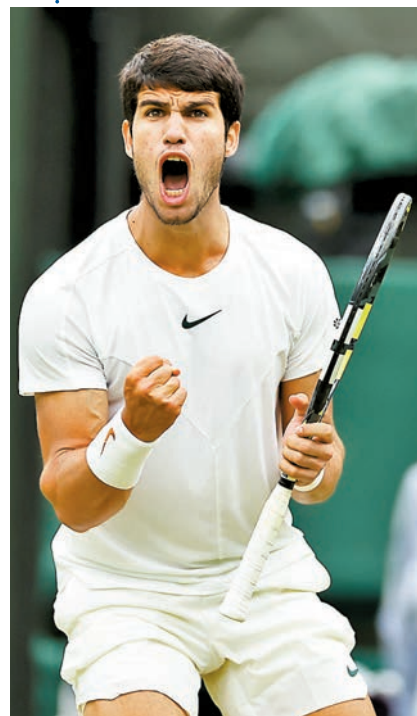
◆艾卡拿斯期望在決賽再戰祖高域。