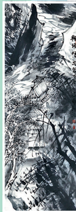
◆廖新作品《禪境悟空》。