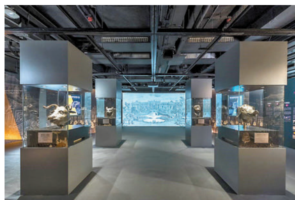
◆第一期展覽展出虎、豬、牛、猴共四尊獸首銅像。

體驗、創新藝術科技、擴增實境（AR）、混合實境（MR）、人工智能（AI）技術和其他創新互動手法，讓觀眾得以動態方式理解世界文化遺產的保育。處於長春園最東北位置的西洋樓群，是中國首次仿建的一組西式宮殿和噴泉建築，被譽為「東方凡爾賽宮」，展覽還原了長春園西洋建築總平面佈置圖，觀眾以iPad或手機對準各個二維碼，便能看到當時每個建築的線稿草圖。其他展品包括商周、春秋戰國、兩漢時期近30件國寶級青銅文物，以及多件清代的琺瑯彩瓷等。今次展覽亦有香港藝術館、香港大學美術博物館、香港中文大學文物館等多間博物館借展所藏早期中國青銅器等重要珍寶，藉此追溯清宮帝皇，乃至中國歷代文化中，從「器」到「禮」禮樂儀式制度的不斷演進和發展。