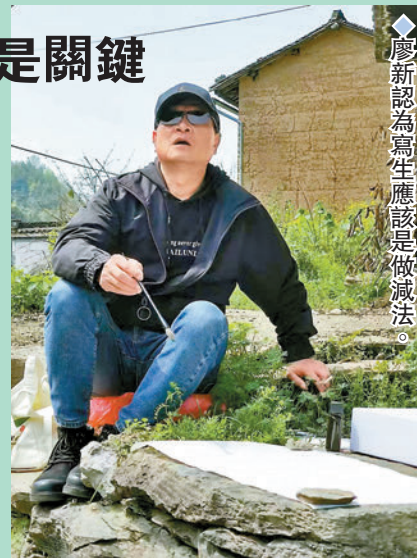
◆廖新認為寫生應該是做減法。

廖新也表示，寫生對於繪畫者來說應該是做減法，並非要把看到的自然一五一十都畫出來，而要提煉其特點和特色，用自己的繪畫語言描繪出來。他舉例，很多畫家都去過安徽的皖南寫生，其獨特的建築風格十分入畫，但眾多畫家中現當代畫家吳冠中筆下的皖南建築最是讓人印象深刻，因為他將皖南建築特色的馬頭牆進行了提煉，雖只有寥寥幾筆，觀者卻一眼便知。