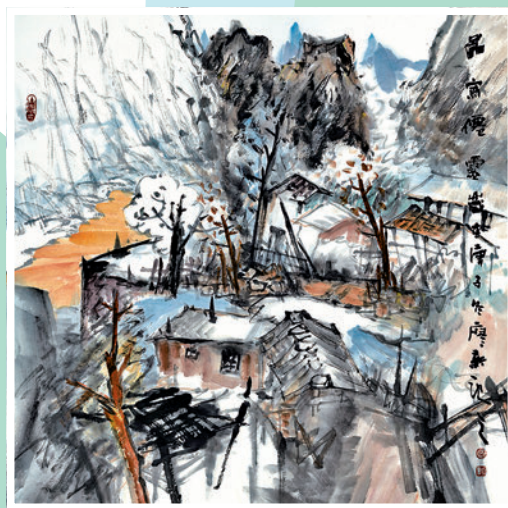
◆廖新作品《圖寫仙靈》。