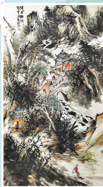
◆廖新作品《仙幽禪深》。