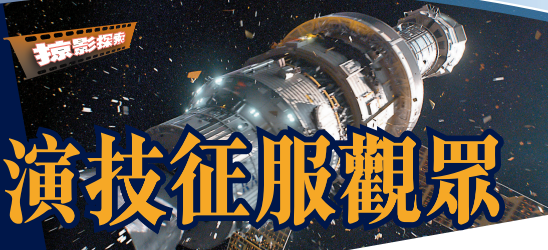
◆《非正式作戰》導演金成勳 ◆河正宇飾演的外交官，朱智勳飾演的司機。