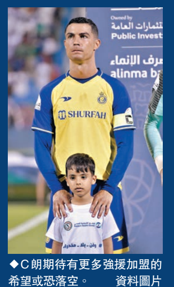
◆C朗期待有更多強援加盟的希望或恐落空。

根據國際足協裁定，在尼日利亞球員穆沙於2018年回歸後，艾納斯未能向李斯特城支付39萬英鎊的附加費以及利息。艾納斯早在2021年就被通知，在裁決正式發布後他們必須向李斯特城支付欠款。然而，他們似乎無法做到這一點，因此受到了禁止註冊新兵的懲罰，更糟糕的是禁令是連續三個轉會窗，這讓球隊打造明星球隊的大計陷入停滯。不過，報道稱只要艾納斯能在半個月內找清尾數，禁令便有望獲解除。