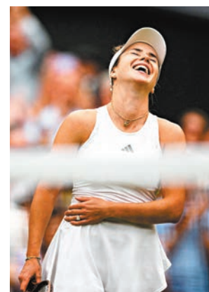
◆施維杜蓮娜喜出望外。