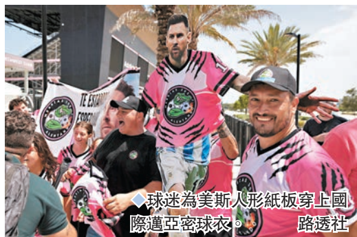
◆球迷為美斯人形紙板上國際邁阿密球衣。