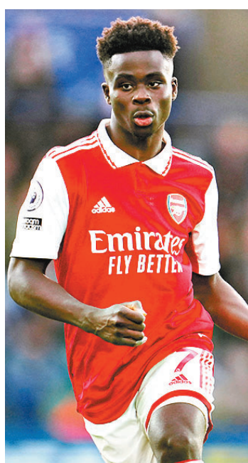
◆阿仙奴翼鋒布卡約沙卡身價續漲。資料圖片