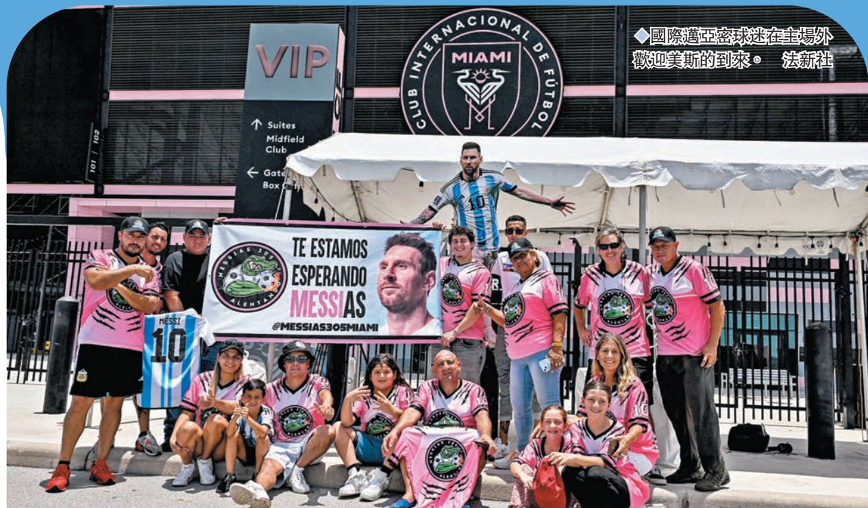
◆國際邁阿密球迷在球場外歡迎美斯的到來。

美斯去年在卡塔爾世界盃終於實現國際大賽冠軍夢，填補了其職業生涯的冠軍空白。上賽季他遭到巴黎聖日耳門球迷的噓聲，認為他要為球隊在歐洲賽場的失利負上一定責任，加上因為到沙特阿拉伯出席商業活動一事被球會處罰，都被認為是他離開這效力兩年的法甲豪門之導火線。