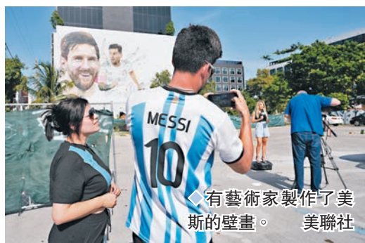
◆有藝術家製作了美斯的壁畫。