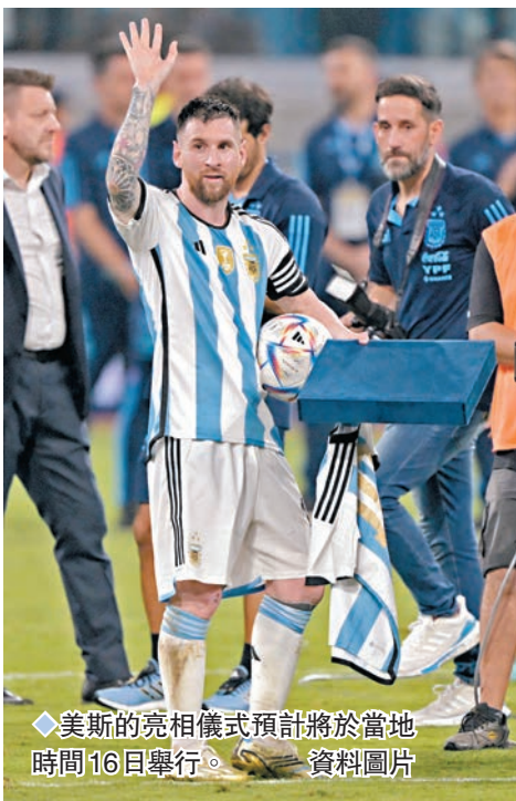
◆美斯的亮相儀式預計將於當地時間16日舉行。資料圖片