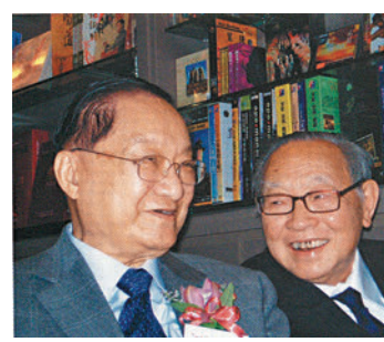
◆2006年12月，金庸與梁羽生(右)曾於公開活動上聚首。

據知金庸曾公開承認，他的祖籍是江西婺源，後來才遷居浙江海寧。這指責，是否將江西詩派都一網打盡？