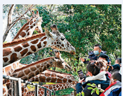
◆圖為遊客在廣州動物園觀賞長頸鹿。

辯論比賽的辯題不是無的放矢，最起码是具有可辯性，也即是有進行思考辯論的價值。這些價值或多或少都聯繫着真實世界、社會生活中的重要問題。因此，辯論要打得好，除了思考邏輯、口才辯技外，更高階的是辯論員是否具有關懷公共問題的心態，而這也是決定辯論水平的關鍵。今天筆者以「開設動物園對保護動物弊大於利」這條比賽辯題為例，與大家進一步分享。