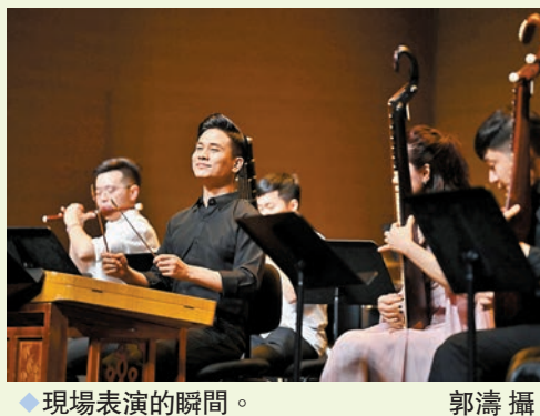
◆現場表演的瞬間。