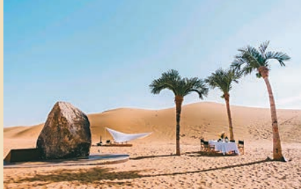
◆酒店戶外沙漠景色