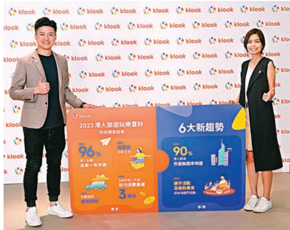
◆《2023港人旅遊玩樂喜好》問卷調查結果發布會。

透過Klook早前的調查，探究港人外遊時，會否影響他們在港娛樂和休閒消費。數據裏表示了近九成受訪者表示本地遊消費不會受外遊影響，另外，超過八成表示在在疫情之後更加留意和支持本地遊，Klook香