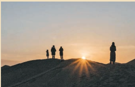
◆遊客觀賞夕陽西下