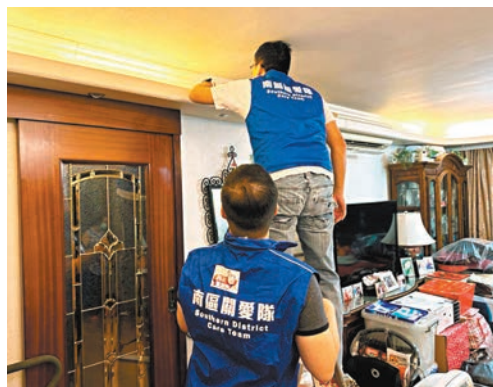
◆南區薄扶林關愛隊應獨居長者的要求，為其家居更換光管。

關愛隊的服務範圍十分廣泛，其中包括日常的社區關愛服務、協助政府處理突發或緊急的事務、配合政府的政策活動宣傳，例如國民教育活動以及認識基本法活動等等，並在一些傳統節日，例如中秋節或香港回歸紀念日等，舉辦相關慶祝活動，以加強居民對中華文化的認識、加深國民身份認同和增加民族自豪感。