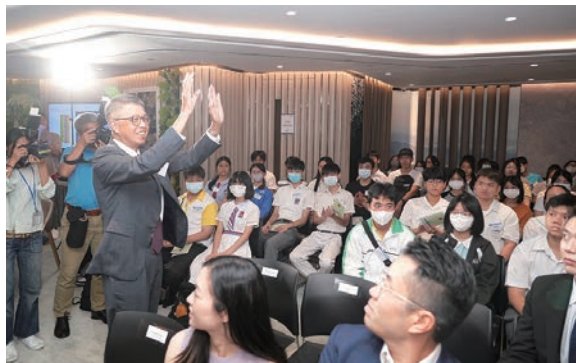
◆ 吳天海出席計劃迎新活動為實習學生打氣。

「學校起動」職場體驗計劃於日前（7月17日）正式展開。按計劃，逾30家商業機構今年暑假將為來自43間中學的140多名高中學生提供實習職位，讓學生參與為期兩至四星期暑期實習，親身體驗真實的職場工作環境。大會於計劃迎新活動舉辦當天，邀得「學校起動」計劃基金會委員會主席吳天海和支持機構代表出席，為同學打氣。