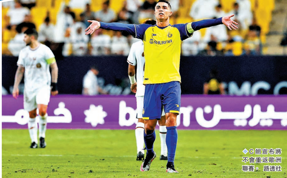
◆C朗宣布將不會重返歐洲聯賽。

在儀式上，根度簡亦透露為何自己選擇巴塞，他表示自己從小就希望為巴塞而戰，披上紅藍戰衣是他的夢想，而且他亦希望可以迎接新挑戰，因此選擇轉戰巴塞。他亦指出曾被利雲度夫斯基和達史特根真誠的對話感動了，令他對巴塞隆拿這座城市更加嚮往，雖然後來他指這不是決定性因素，但由此可見利雲度夫斯基和達史特根對這次轉會亦有推波助瀾的作用，促使根度簡加盟巴塞。