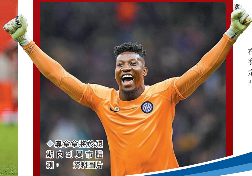
◆奧拿拿將於短期內到曼市體測。 資料圖片