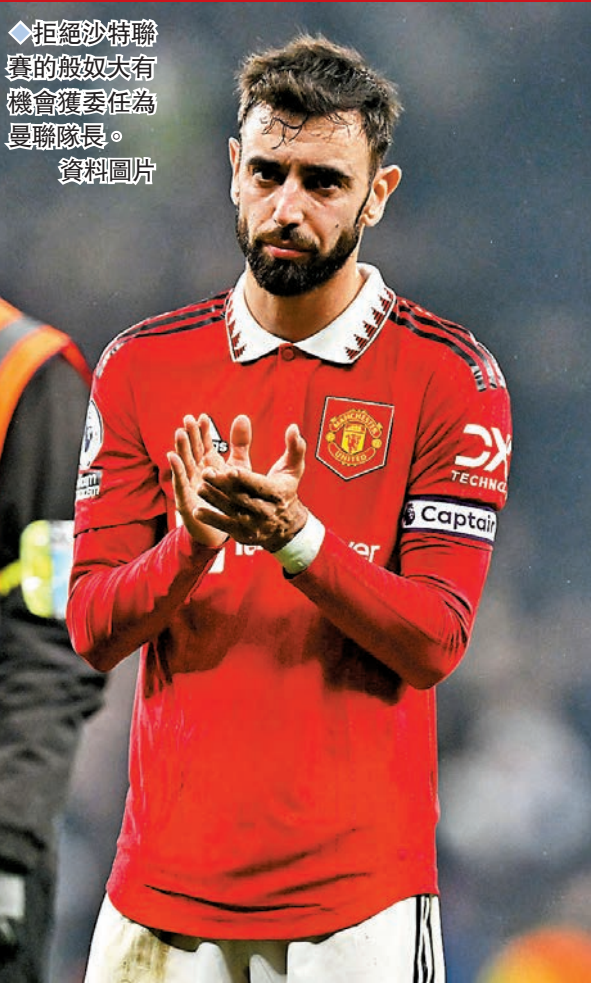
◆拒絕沙特聯賽的般奴夫有機會獲委任為曼聯隊長。

根據《The Athletic》報道，曼聯一直希望和合約到期前便完結的拉舒福特完成續約，但由於早前曾傳出曼聯希望建立健康的薪金系統，故只會給予拉舒福特約25萬英鎊周薪；然而，報道指曼聯的確已經與拉舒福特商討好合約細節，雙方更會於本周內官宣成功續約，但拉舒福特的周薪卻是37.5萬英鎊，即完全全繼承了今夏離隊的迪基亞的合約，讓這位曼聯青訓產品成為全隊最高薪球員。而根據資料，拉舒福特亦將成為全英超第二高薪的球員，僅次於曼城中場迪布尼。