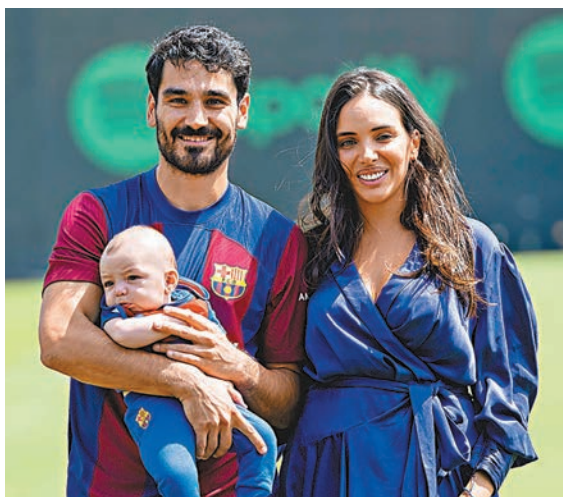
◆根度簡帶同妻子和兒子出席記者會。