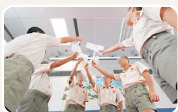
◆在囚考生高興地展示成績單，分享努力的成果。

沙咀懲教所監督陳文益表示，為協助在囚青少年持續進修，懲教署早前邀請香港都會大學及八所教會資助大學代表出席課程資訊分享會，逾百名青少年在囚者參與，以了解升學資訊。此外，懲教署在沙咀、壁屋及勵敬懲教所設立名為LOD的在囚者電子學習平台，同學可透過平板電腦及內聯網，瀏覽不同範疇及不同程度的電子學習材料，方便他們自學。