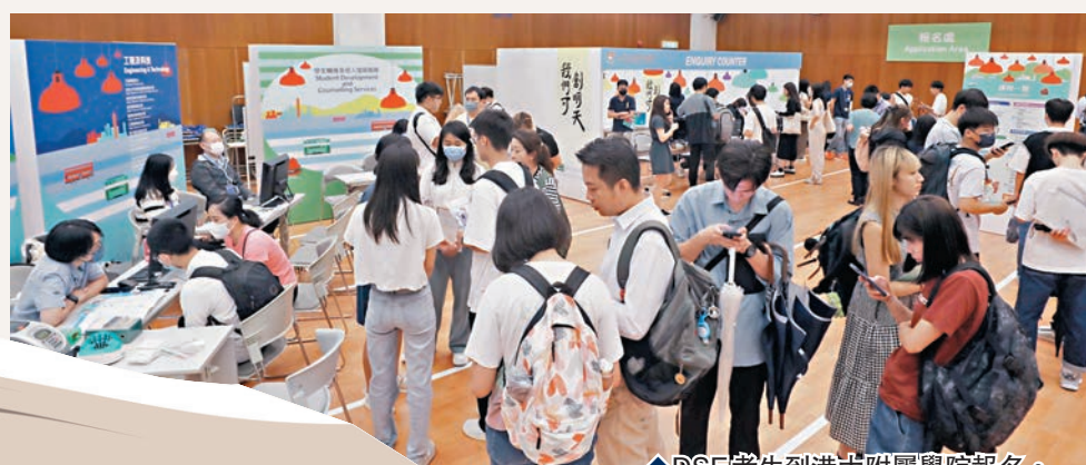
◆DSE考生到港大附屬學院報名。