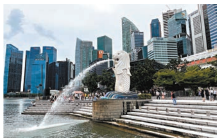
◆香港金融和科技行業專業人士的薪酬，比競爭對手新加坡的高得多。

香港文匯報訊(記者 曾業俊)香港人才嚴重流失，特區政府近年積極「搶人才」，銀行及保險業界「搶人」情況尤其激烈。據彭博報道，香港的銀行和保險公