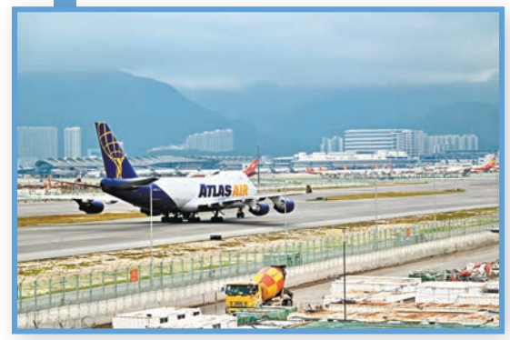
◆空運業在2023年3月的空缺率最高，達13.3%。 資料圖片

文件又指，為解決較高層級職位的人力短缺問題，以及鑑於7項輸入人才計劃的獲批人數於過去3年持續偏低，政府最近已採取便利措施優化上述計劃，加強吸納外來人才。此外，政府推出新的高端人才通行證計劃，容許該等人才無須事先獲得聘任，便可在港逗留最多兩年。文件指相關措施反應良好，2023年的首5個月便已有約4.9萬宗的人才申請獲批，包括在高才通計劃下的2.1萬多宗(佔42.9%)。至於中低層職位方面，補充勞工計劃於2019年至2022年期間的每年輸入勞工人數大幅上升72.6%，達到5,829人，升幅主要見於院舍護理員。今年6月，政府採取「雙軌並行的方法」，包括為院舍服務業、建造業及運輸業推出行業輸入勞工計劃，整體配額為2.7萬個。