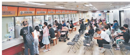
◆圖為上周末，入境處增設特別服務時段方便市民領取旅行證件。資料圖片

他的旅行證件，無須預約及不設限額，以先到先得的方式領證。入境處同時提醒市民，在領取旅行證件時，必須將現時所持有的舊旅行證件交回入境處註銷(首次申請及遺失除外)。如有查詢，可致電入境處查詢熱線2824 6111或發送電郵至enquiry@immd.gov.hk與入境處人員聯絡。