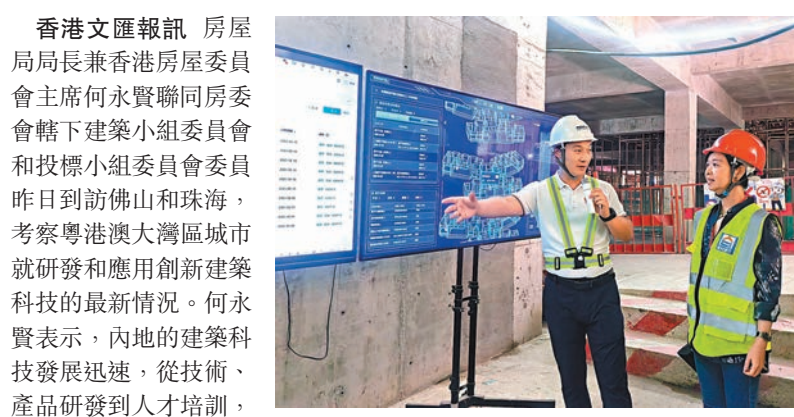
◆何永賢(右)到佛山廣東博智林機器人有限公司參觀。

香港文匯報訊 房屋局局長兼香港房屋委員會主席何永賢聯同房委會轄下建築小組委員會和投標小組委員會委員昨日到訪佛山和珠海，考察粵港澳大灣區城市就研發和應用創新建築科技的最新情況。何永賢表示，內地的建築科技發展迅速，從技術、產品研發到人才培訓，皆做到自主、高質量發展。考察團成員亦對成熟的技術和產品充滿信心，期望它們有助房委會建屋時「提速、提效、提量、提質」之餘，亦令工程更環保，及為工人提供更安全和理想的工作環境。