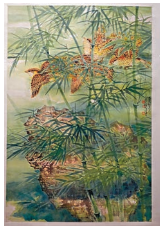
◆《竹禽圖》為謝、陳二人所合作。

謝稚柳與張大千亦是摯友，兩人交往頻繁，曾一同前往敦煌寫生長達一年時間。「張大千注重臨摹，請了許多助手臨摹那些古畫；但謝稚柳就做了不一樣的事，他參觀洞窟，度量畫中的每一物件的大小，作為後來鑒定研究的參考。」但敦煌之旅也改變了謝稚柳的作畫題材，如《觀世音菩薩像》就是他從敦煌返回後所作，在此之前，人物畫他畫得並不多。