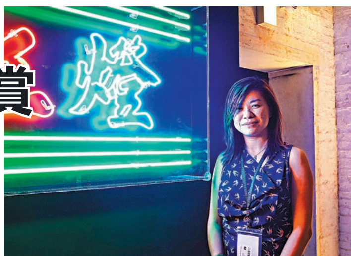
展覽：「霓鏡」 展期：即日起至9月3日 時間：中午12時至晚上8時 地址：大館01座複式展室、洗衣場石階