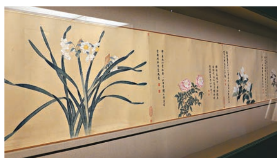
◆陳佩秋《仿錢選八花圖卷》（部分）

藝術館也邀請藝術團隊Dimension Plus，利用「新畫布」（AI技術），建構了一個跨越時空的場域特定裝置《稻浪四時》，動態呈現四時更迭，讓觀眾感受兩位畫家不同的創作節奏。這一空間內布滿稻穗，微風輕拂中，在綠色與黃色之間不斷變幻，Dimension Plus 創立人之一林欣傑