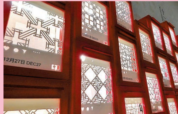
◆伊藤彥子《生日快樂 Likeboxes》（局部）