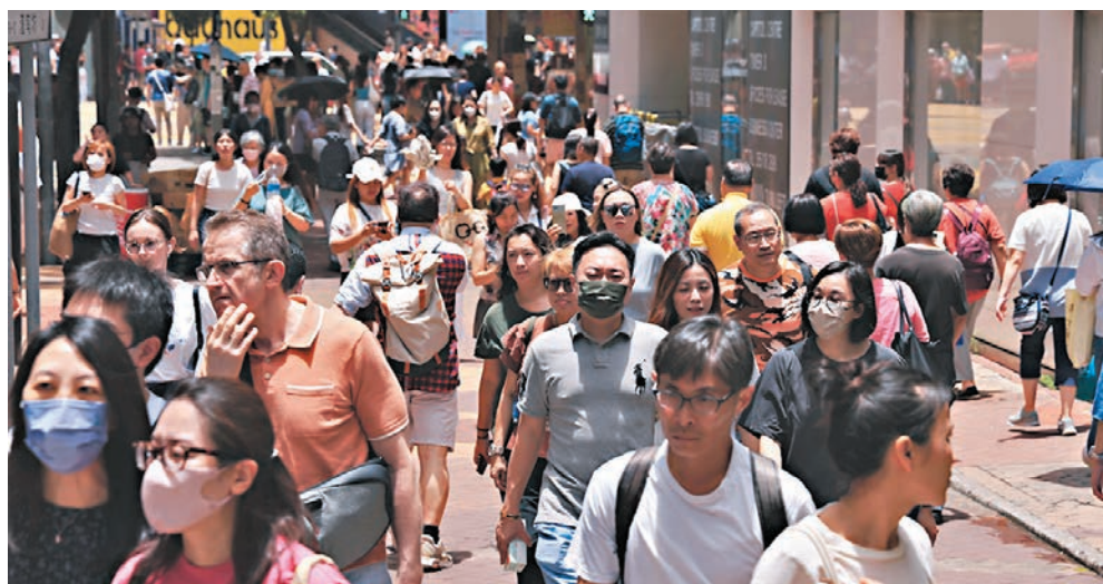
衛生署發布首份全港碘質水平調查結果發現,35歲或以上港人碘攝取量不足和輕度缺碘。圖為銅鑼灣街頭。

衛生署認為,35歲或以上人士的碘攝取量普遍不足,很可能與整體食物攝取量有關。年輕人每日所需的能量多,所以食量較大,