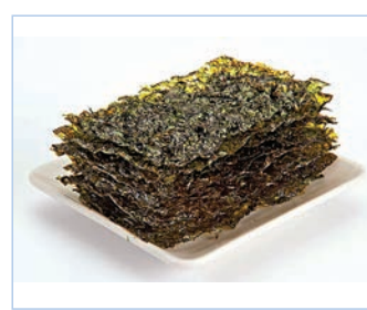
衛生署建議,市民應選吃如紫菜等碘質豐富的食物。

預防碘缺乏病工作小組聯合建議,市民選食碘質豐富的食物,例如紫菜、海帶、海魚,但食用碘質豐富的零食時,要避免高鹽或高脂肪的零食。市民亦可使用加碘的食鹽以代替一般食鹽,但要確保每天食鹽的總攝入量少於5克,即大約1茶匙,以降低患上高血壓的風險。