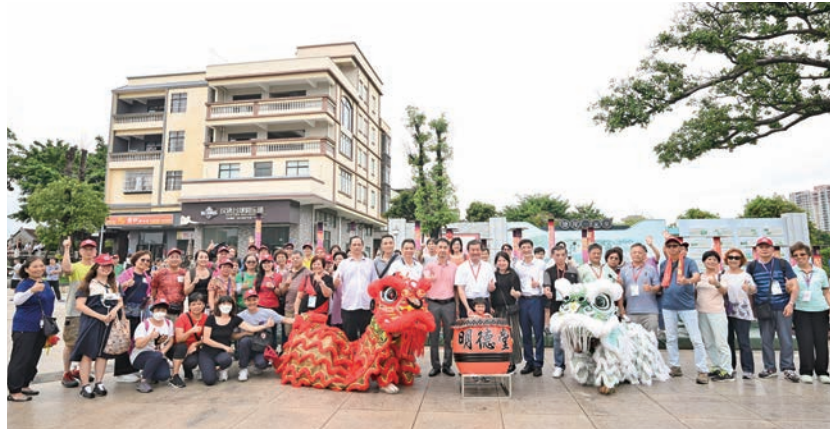
◆東莞同鄉總會在塘尾古村落欣賞明德醒獅表演梅花樁合照。