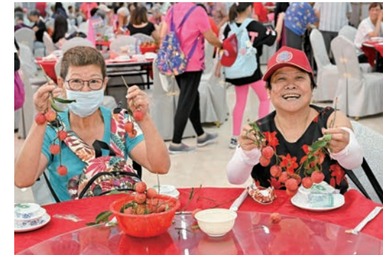
◆鄉親們啖荔枝敘鄉情，充滿歡聲笑語。