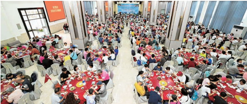
◆逾千鄉親在企石村喜宴樓分兩層相聚一堂，共晉午餐，品嚐荔枝。