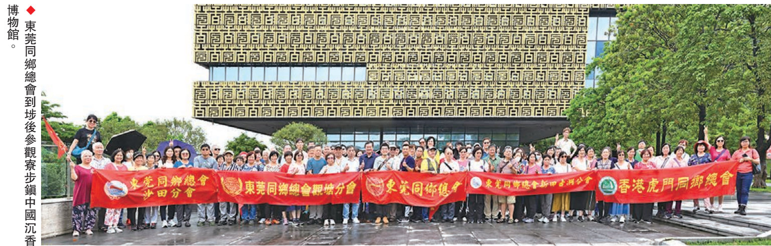
◆東莞同鄉總會到步後參觀步鎮中國沉香博物館。