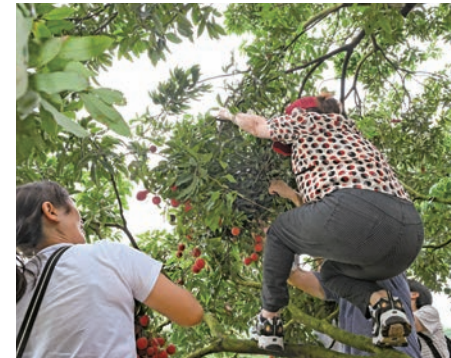
◆鄉親到茶山鎮荔枝園親身採摘荔枝。