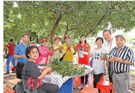
◆鄉親現場即時品嘗採摘成果。