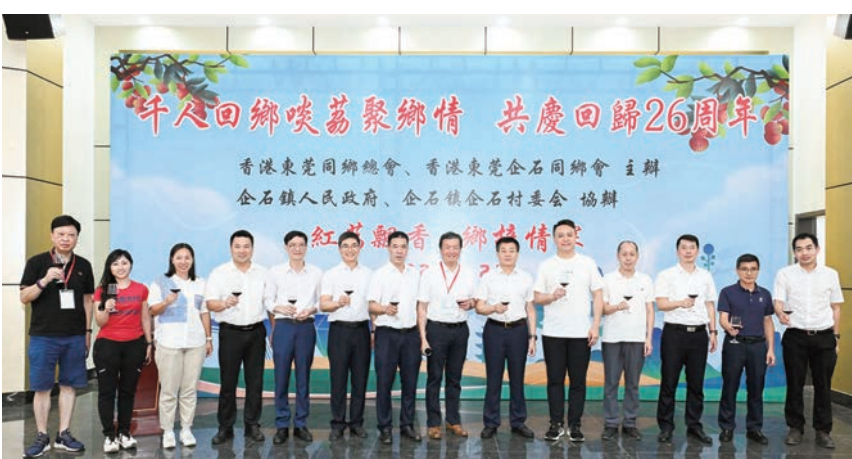
◆主禮嘉賓舉杯同慶香港回歸祖國26周年。