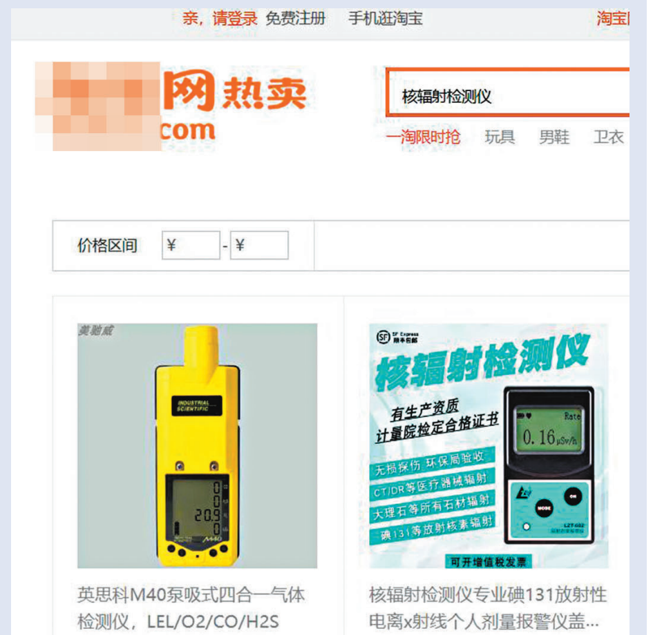
◆ 購物網站上有大量核輻射檢測儀售賣。