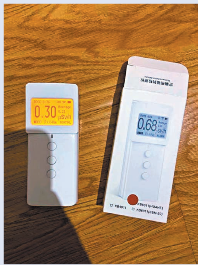
◆ 網友「零度君」在網上分享自己購買的核輻射檢測儀。香港文匯報深圳傳真

從準確性和可靠性等專業角度看，醫療機構等輻射檢測場所使用的檢測儀都是需要專業機構定期檢測校正，大多數自購的便攜式輻射檢測儀器往往質量參差不齊，缺乏專業認證和標準，也不能完全代替專業設備和專業人員進行輻射監測和評估，使用時容易出現誤判或不準確的結果。對於普通市民來說，購買類似的「核輻射檢測儀」往往無必要且可能不準確。如果有輻射擔憂，應尋求專業機構的幫助，並且遵循官方發布的信息和指導。