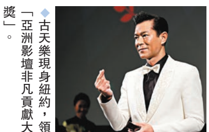
◆古天樂現身紐約,領「亞洲影壇非凡貢獻大獎」。

亞洲電影節《送院途中》的首映禮。於開場前獲大會頒發「亞洲影壇非凡貢獻大獎」。古仔在頒獎台上感謝大會肯定,並在提到香港電影人在疫情期間,一直沒有改變本質,依然用心製作電影「少了任何一個幕後崗位,一部電影都很難誕生。所以我拎到呢個獎,係團隊的功勞,絕對唔係我個人榮耀。」古仔亦有留意,近日在荷里活發生的美國編劇和演員工會的罷工行動,他就指人類的創造力和情感都非常重要。「AI(人工智能)提供給人類方便和功能性,但永遠戰勝不了人類的創造力和情感,只有創造力和情感才能令電影感動到觀眾心靈。」古仔說畢獲得全場掌聲,他亦