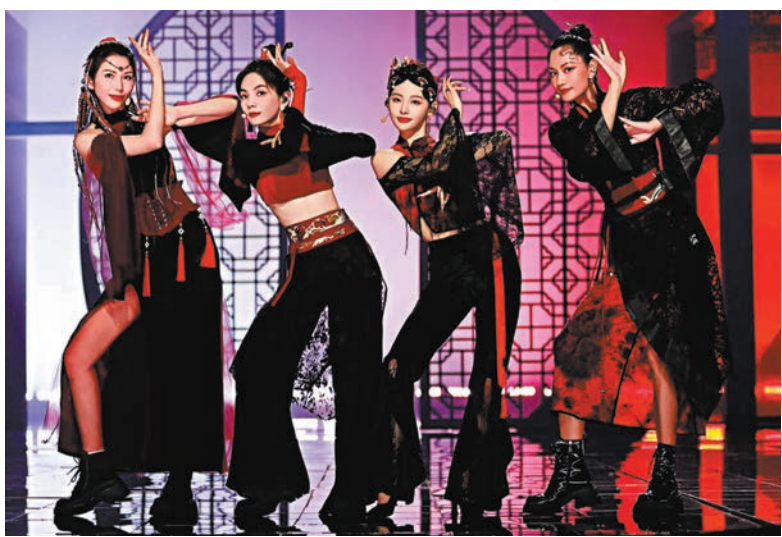
◆蔡少芬(左一)在成團夜表演《絕世舞姬》。