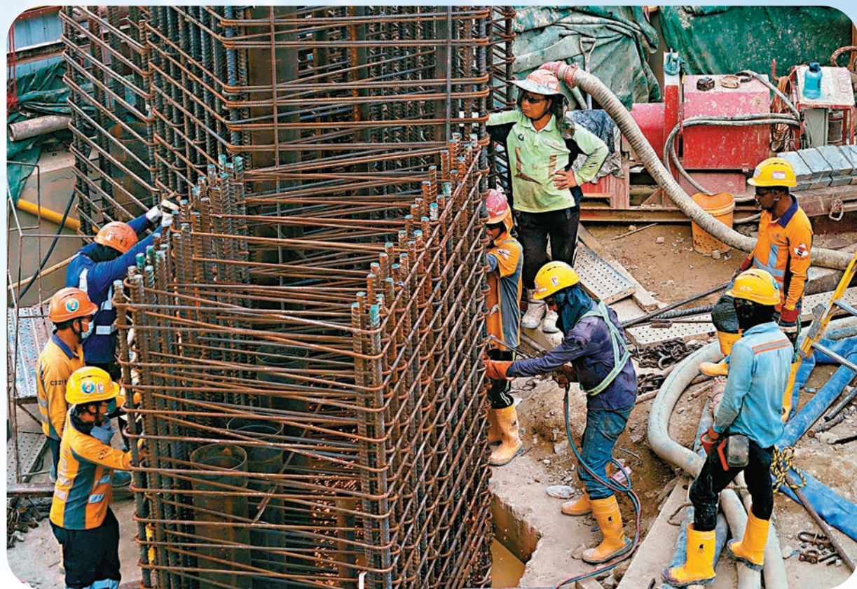
▲工會調查指，近六成受訪工友曾在酷熱天氣下工作時感到疑似中暑症狀，約半數受訪者表示僱主未根據暑熱警告指引為員工安排休息時間。圖為地盤工人在酷熱天工作。