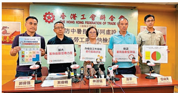
◆工聯職安健協會昨日公布「酷熱天氣下工作問卷調查」。