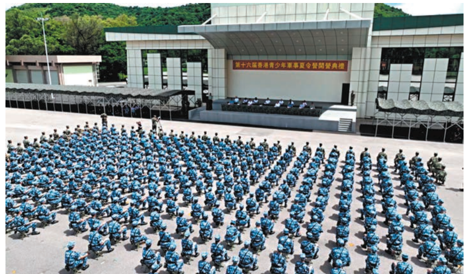
◆第十六屆香港青少年軍事夏令營開營。

香港文匯報訊 第十六屆香港青少年軍事夏令營昨日在駐香港部隊新圍軍營舉行開營典禮，來自香港百餘所學校的青少年精神抖擻，整齊列隊，開始自己的軍營生活。上午10時30分，駐香港部隊三軍儀仗隊步履鏗鏘、昂首闊步護旗而出，在雄壯的國歌聲中，五星紅旗冉冉升起，青少年們莊嚴肅立，與解放軍官兵一起高唱國歌。升旗儀式結束後，全體學員鬥志昂揚，莊嚴宣誓，眼神中充滿了堅毅，做好了迎接軍營生活的準備。