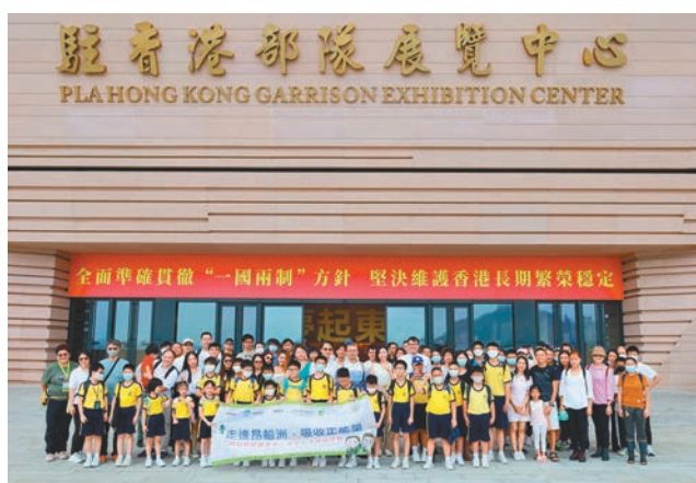
◆明匯智庫日前組織百多位香港青少年，前往位於昂船洲軍營的駐港部隊展覽中心參觀。

明匯智庫表示，這次到駐港部隊展覽中心參觀，是得到特區政府公民教育委員會支持的系列活動其中一項重要內容，希望青少年通過參觀展覽，並與駐軍溝通交流，了解中華民族的燦爛文明史，以及解放軍的光榮歷史，從中吸收更多的正能量。