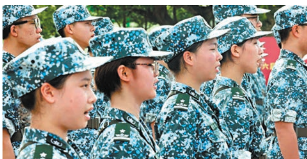
◆青少年們莊嚴肅立，與解放軍官兵一起高唱國歌。