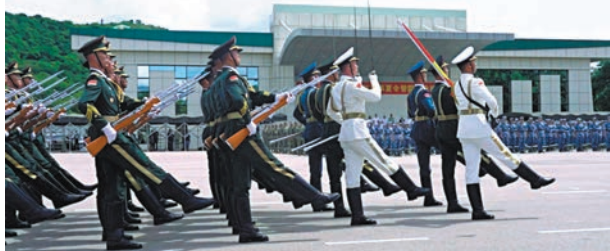
◆駐香港部隊三軍儀仗隊步履鏗鏘、昂首闊步護旗而出。