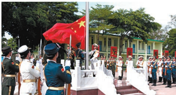
◆全體肅立進行升旗儀式。

今年的青少年軍事夏令營活動，駐香港部隊聚焦愛國主義和國防教育主題，突出軍營文化特色，結合香港青少年實際，主要安排了軍事訓練、教育講座、參觀見學等一系列活動，讓青少年們在豐富的訓練和教育活動中，了解祖國的國情和國防知識，培養守紀自律、團結協作、吃苦耐勞精神，為未來服務香港、報效國家打下重要素質基礎。