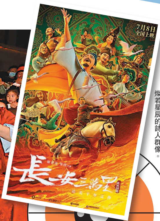
◆《長安三萬里》塑造了盛唐時期燦若星辰的詩人群像。