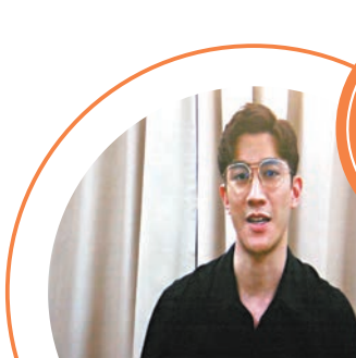
◆李治廷拍片表示身邊朋友也遭遇網絡欺凌。

香港文匯報訊(記者達里)自電影《給十九歲的我》風波後鮮少露面的導演張婉婷，昨日以首席評審身份出席《網絡清涼》——向網絡欺凌說不，短片製作比賽2022/23頒獎禮，未有接受傳媒訪問的她，在台上分享對網絡欺凌的看法及比賽評審準則。張婉婷表示評選準則最重要是作品內容要有感染力，表達故事的手法，拍攝的技巧、演員演技、燈光和攝影配合都缺一不可。張婉婷又稱很多人其實在不知不覺間都成為欺凌者，有時以為自己是幫人出頭，伸張正義，加上網絡上匿名的關係，言論就會變得愈來愈激進。她表示以言論自由為前提下，很難去預防網絡欺凌，反而建議被欺凌者不要看網上言論，免得愈看愈傷心。張導演更分享朋友被欺凌的例子，說：「我有朋友被網上欺凌，我勸過他不要多看，但他沒有聽，結果就要去看心理醫生，搞到要服用抗抑鬱藥和甩頭髮。我都知道年輕人很難不上網，但『腦殘』的人就不要多看，避免影響心情。」原來會出席頒獎禮的評審李治廷因有工作在身未能到場，他透過短片表示身邊朋友也遭遇網絡欺凌，而且情況愈來愈嚴重和普遍。同時，李治廷大讚參賽作品很有水準，拍得很用心和有同理心，證明好的作品只要發自內心，無論用什麼形式去拍攝，都可以感動到人。