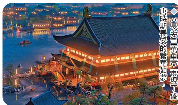
◆《長安三萬里》再現了盛唐時期長安的繁華如夢。