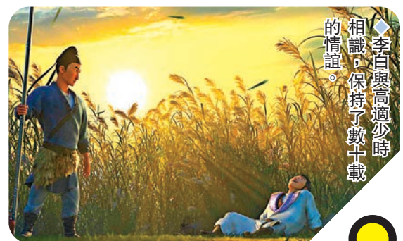
◆李白與高適少時的相識，保持了數十年載的情誼。

多達48首，如何通過動畫電影充滿想像力的視覺語言把詩詞意境展現出來，考驗創作者的匠心和創意。謝君偉說，影片籌備階段，主創團隊前往陝西、四川等多地採風，參考了近100本相關書籍，結合圖片資料，做了大量研究，除了長安城景，片中出現的揚州城景、黃鶴樓、胡姬酒肆、曲江池、岐王府、梁園、雲山城、塞外等眾多大唐場景和建築都係經過精心還原。最終片中以古畫、水墨、炭筆等不同方式呈現了不少熟悉的詩句畫面，同時從「山頂千門次第開」的錦繡長安到「二分明月是揚州」的秀美揚州，從「白雲千載空悠悠」的黃鶴樓到「兩岸猿聲啼不住」的三峽奇景，再到梁園、潼關、松州、蜀北的風光……詩從紙面走到眼前，變成了故事。去創想活靈活現的創作過程。