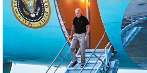
▲拜登2021年3月登上空軍一號時，在階梯上連摔3次。