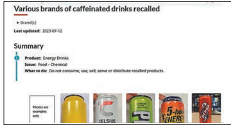
▲(上圖)專家認為包裝只建議18歲以下兒童不飲用欠力度。(下圖)加拿大衛生部下令回收多款違規能量飲品。