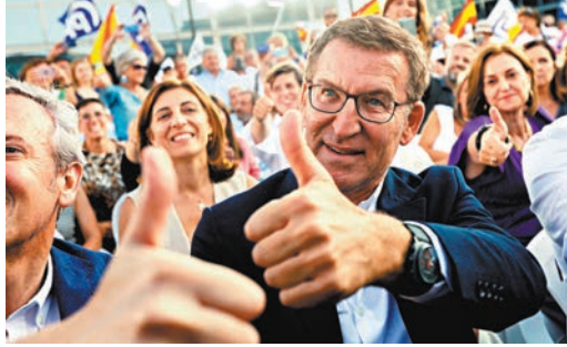
首相桑切斯稱社會黨正急起直追。