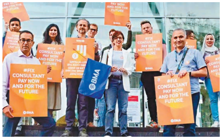
英國醫學會的顧問醫生舉行罷工，要求改善薪酬。

香港文匯報訊 據《衛報》報道，英國國家醫療服務(NHS)的資深醫生正大量流失，他們紛紛前往愛爾蘭、澳洲和阿聯酋等國家工作，因可賺取雙倍薪酬，並享受更好的工作條件。 報道稱，NHS負責人對愈來愈多經驗豐富的醫生外流到外國醫療系統感到擔憂，指這趨勢加劇NHS的人手短缺危機。英國不少醫生一直對薪酬水平不滿，其中NHS顧問醫生就薪酬問題與政府談判破裂，上週五舉行罷工行動。並將於下月底再次罷工。 多年來，全球各地醫療系統一直吸引英國的初級醫生離開NHS，原因是他們年輕，願意到外國工作。但近期有更多資深醫