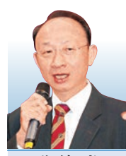
黎偉成 資深財經評論員